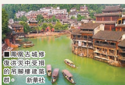
■鳳凰古城修復洪災中受損的吊腳樓建築群。新華社

香港文匯報訊(記者 李青霞 長沙報道)被譽為「中國最美小城」的湖南鳳凰古城內眾多商戶經歷早前嚴重洪災後,本月26日開門迎客。當日,鳳凰縣共接待國內外遊客1.61萬人次。在為期20日的過渡期內,鳳凰古城的部分