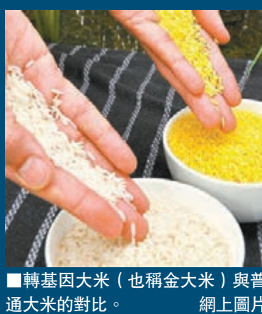
■轉基因大米(也稱金大米)與普通大米的對比。網上圖片

為了統一評價轉基因食品安全性的標準,聯合國糧農組織和世界衛生組織所屬的國際食品規定委員會也已決定制定轉基因食品的國際安全標準。■綜合網上資料