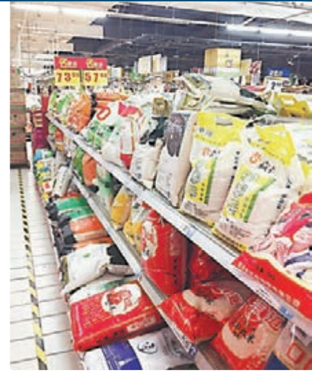
■武漢家樂福超市大米採購區。

香港文匯報訊(實習記者 鄒亞琴 武漢報道)央視《新聞調查》前日曝光湖北武漢超市大米中含轉基因成分,引起社會嘩然。記者今日走訪武漢市多家大型超市,隨機採訪了十多名正在超市購物的市民,發現只有不到半數知曉此事。