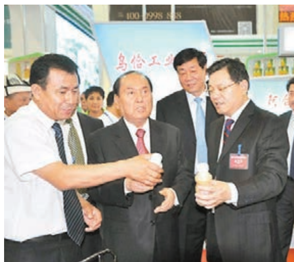
司馬義、鐵力瓦爾地、自治區政府副主席大剛和喀什地委書記曾存參觀喀什會展中心。王辛鵬攝