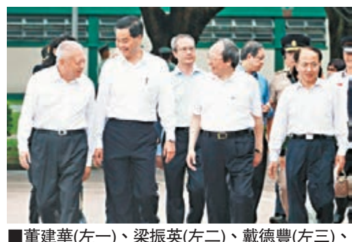
董建華(左一)、梁振英(左二)、戴德豐(左三)、王志民(左四)擔任第十屆香港青少年軍事夏令營的主禮嘉賓。