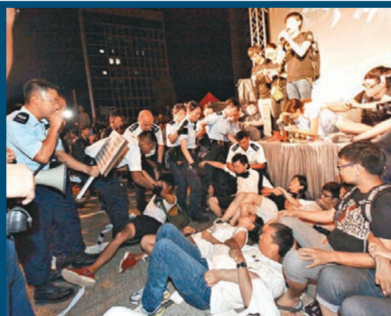
▲佳叔相信反對派在激進勢力牽引下漸失人心。圖為七一遊行當晚示威者堵路情況。