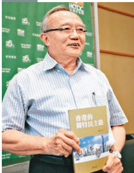
■劉兆佳新書希望各界能從長遠歷史角度，探討香港民主道路。資料圖片

劉兆佳認為，研究香港的民主發展，須一併從香港的歷史及其現實出發，分析香港的國際形勢以及國內環境等，以至香港內部政治勢力，才能夠更透視理解出香港獨特民主路。書中援引自香港殖民主治時代至今的眾多資料，以至現時各地的「顏色革命」案例，指出香港行出一條民主路要謹慎行之，否則會帶來不明朗後果。