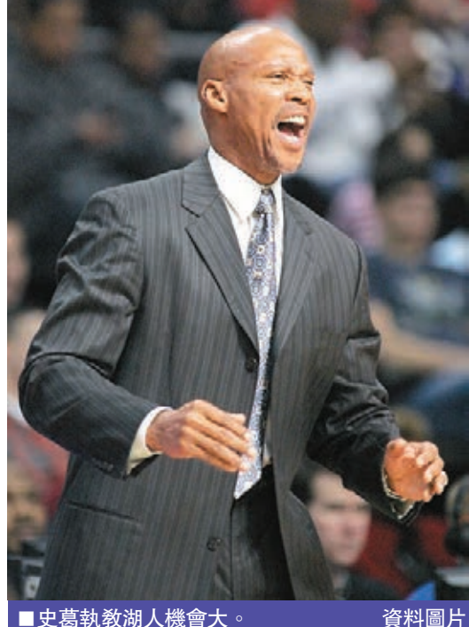
史葛執教湖人機會大。

出場,全課都認真操練,這名全隊身材最高的前鋒甚具「大哥」風範,與主教練白蘭斯以身份則帶隊操練,而「伊巴」也一時技癢,控球展示腳下功夫及挑球射門。大軍今日下午3時再操練一課,早上的晨操則告取消,讓球員有更多休息,適應時差。