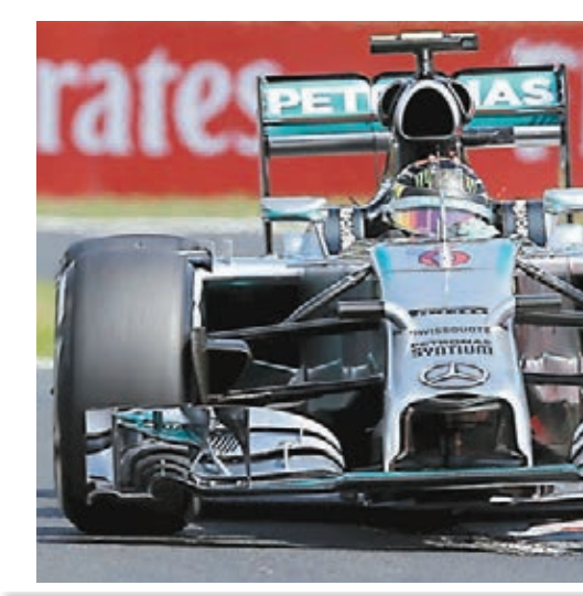
羅斯保做出最快圈速1分22秒715。

一直強調,作為一項運動,我們嘗試從政治的角度脫離出來。國際汽聯擬定了賽程,我們需要跟着走,現階段賽事如期舉行。」 阿塞拜疆後年首辦F1 另外,F1掌舵人艾利斯通周五證實,阿塞拜疆城市巴庫將於2016年首辦F1賽事。艾利斯通表示:「我們非常高興巴庫加入F1大家庭,這將會是街道賽,穿越巴庫最引人入勝和別具一格的部分。」賽事組委會發表聲明指出,首屆F1賽事原計劃在明年舉行,但現決定延遲1年至2016年。 香港文匯報記者 蔡明亮