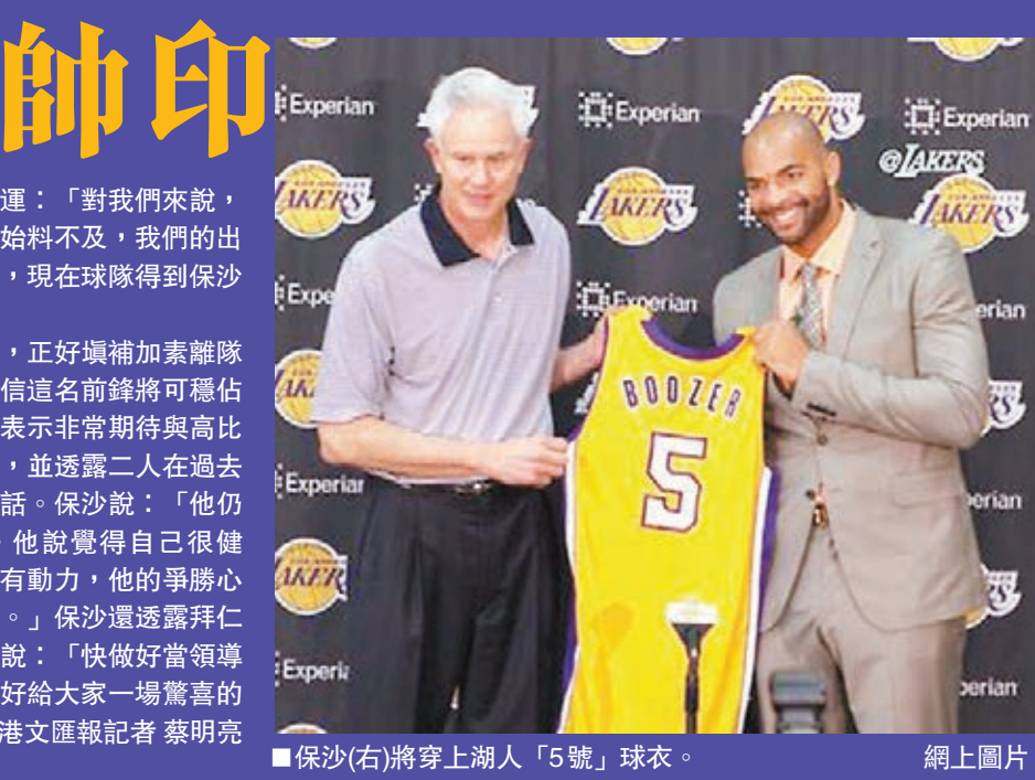
保沙(右)將穿上湖人「5號」球衣。

有運廉價僱保沙 史葛尚未成為新主帥前,湖人周五率先迎來被公牛特赦的前鋒保沙。保沙原與公牛尚餘1年合約,年薪高達1680萬美元,不過被球隊裁走後,湖人僅以325萬美元便將這名前鋒收歸麾下。湖人能夠以廉價獲得悍將加盟,總經理卡普查克坦言感到幸運:「對我們來說,這真是幸運和始料不及,我們的出價竟然是最高,現在球隊得到保沙了。」 保沙的加盟,正好填補加素離隊後的空缺,相信這名前鋒將可穩佔正選一席,他表示非常期待與高比拜仁並肩作戰,並透露二人在過去一周曾多次對話。保沙說:「他仍然做得很好。他說覺得自己很健康,而且非常有動力,他的爭勝心真的很感染人。」保沙還透露拜仁曾發短信給他說:「快做好當領導者的準備,做好給大家一場驚喜的準備。」 香港文匯報記者 蔡明亮