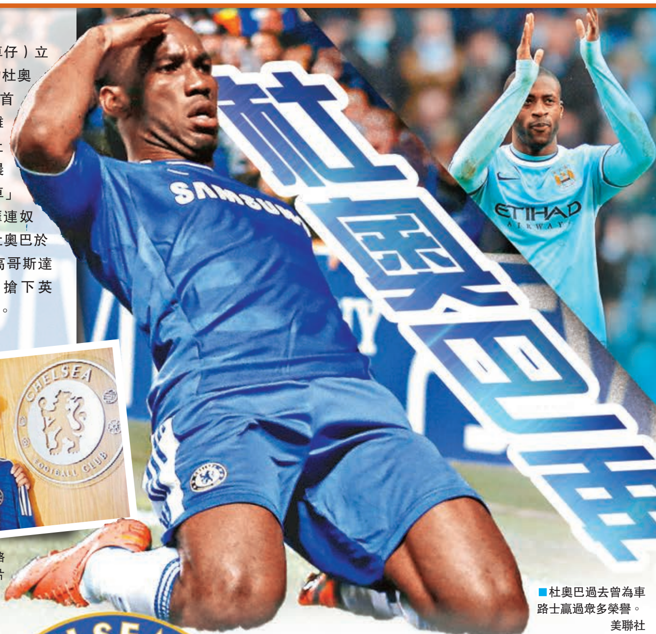
杜奧巴過去曾為車路士贏得過多榮譽。