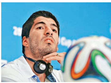
蘇亞雷斯就停賽上訴。