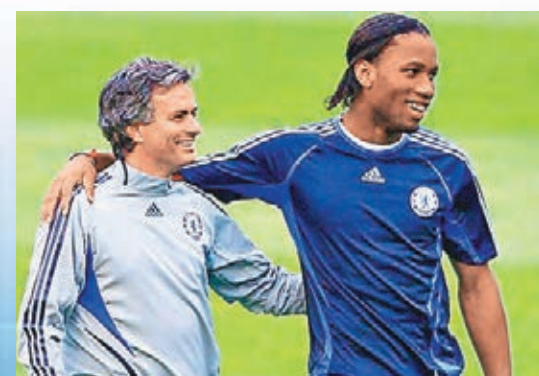
杜奧巴(右)與摩連奴再度聯手。