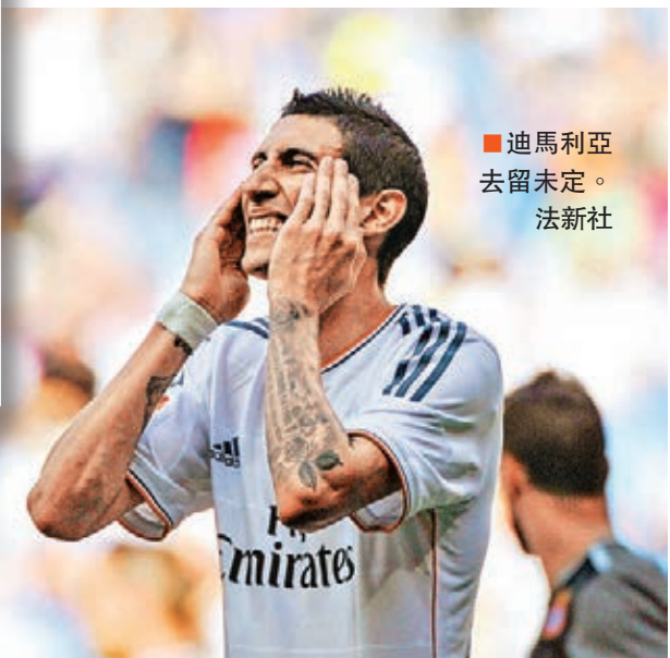
迪馬利亞去留未定。