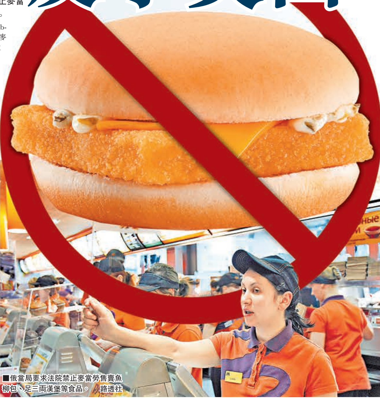
俄當局要求法院禁止麥當勞售賣魚柳包、足三兩漢堡等食品。