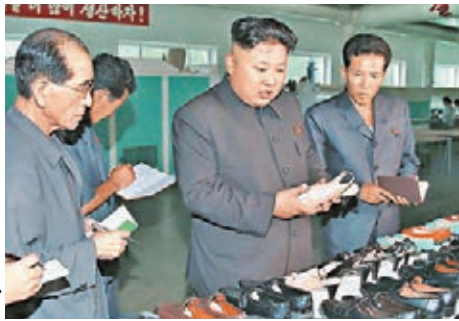
朝鮮領導人金正恩日前參觀鞋廠。

韓國國防部稱，朝鮮昨向東海發射一枚短程彈道導彈，正分析其發射動機。今次是朝鮮本年第15次射導彈，並適逢朝鮮戰爭休戰協定簽署61周年前夕。