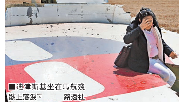
迪津斯基坐在馬航殘骸上落淚。