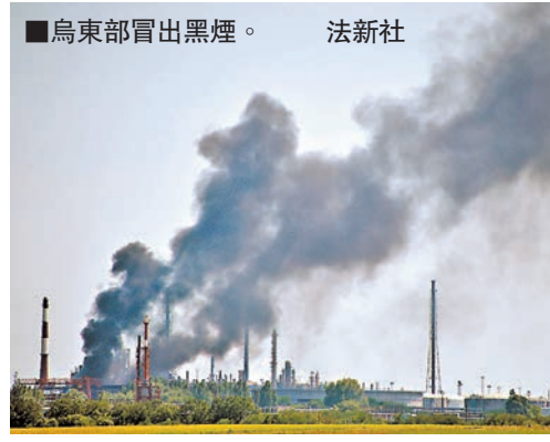
烏東部冒出黑煙。

烏克蘭東部緊張升級，俄羅斯前日證實，烏克蘭有47枚82毫米迫擊炮落入俄邊境地區，造成一名平民受傷；基輔和美國則稱俄向烏克蘭發射5枚火箭炮。華府稱情報顯示新一批俄羅斯武器日內會運抵烏東，批評莫斯科繼續為親俄民兵提供武器，包括多套口徑逾200毫米火箭發射系統，故會進一步加強制裁施壓。