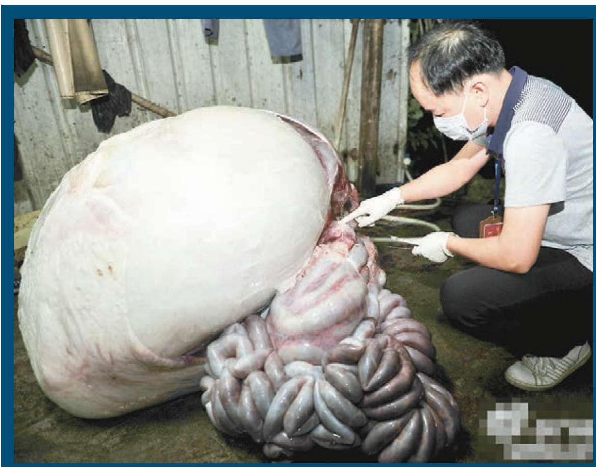
■誇張的注水牛肚大過牛身。

令人擔憂的是該菜市場附近的一條小巷子,有多名肉販子正在銷售牛肉。記者看到,看起來肉質不錯的牛腩,每斤價格只要12元。對於牛肉的來源,攤販拒絕透露。