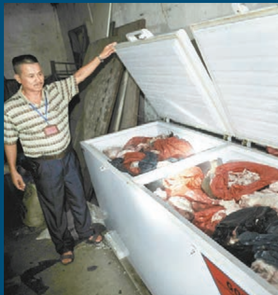
■現場繳獲藏於櫃內的問題牛肉及牛內臟。