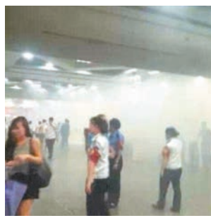
■現場煙霧瀰漫,不少旅客劇烈咳嗽。

兩小時後廣鐵公安對此事通報稱,事件起因是旅客攜帶違禁物品發生化學反應,引發大量煙霧。事發時,安檢員正對一名旅客的包裹進行檢查。當打開行李包後,裡面的化學品突然發生化學反應。至截稿時止,警方尚未對肇事旅客身份以及化學品爆燃原因等相關情況作進一步說明。