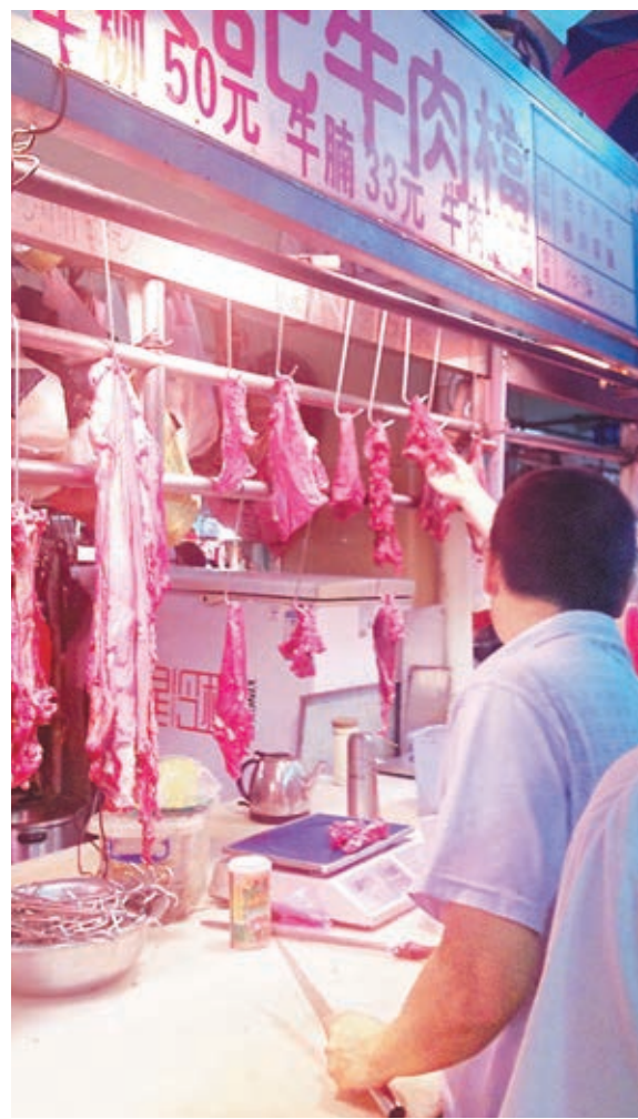
廣州市面牛肉價格每公斤接近80元。