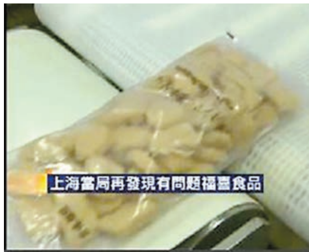
上海當局再發現有問題福喜食品