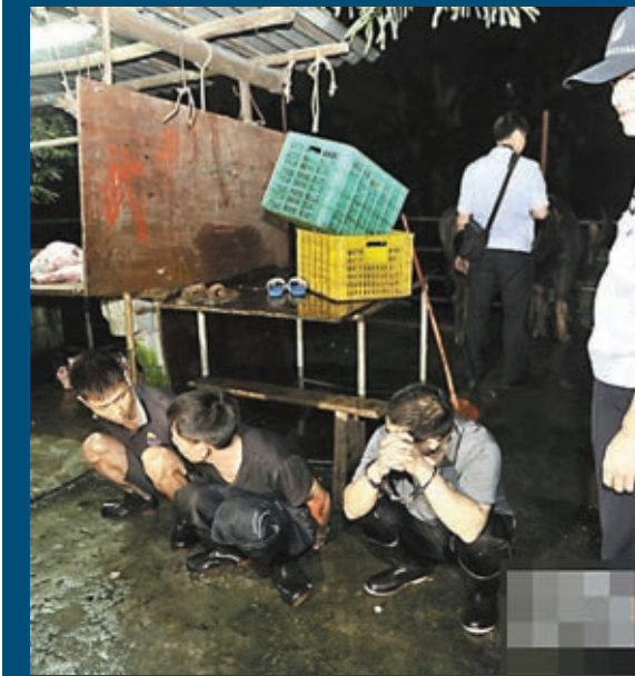
■搗破非法屠宰場現場的幾名嫌犯。