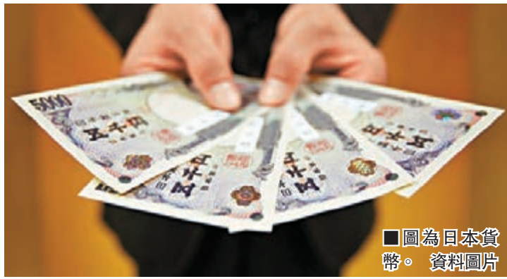
圖為日本貨幣。

到美國上週首次申領失業救濟人數下跌影響,美元走勢偏強,引致現貨金價周四跌幅擴大,一度走低至1,287美元附近。隨着現貨金價下跌至1,287美元附近1個月以來低位,部分投資者先行回補黃金空倉,現貨金價周五曾反彈至1,296美元附近。由於美元近日有逐漸轉強傾向,對金價造成壓力,故此金價將可能稍為下移。預料現貨金價將反覆走低至1,285美元水平。