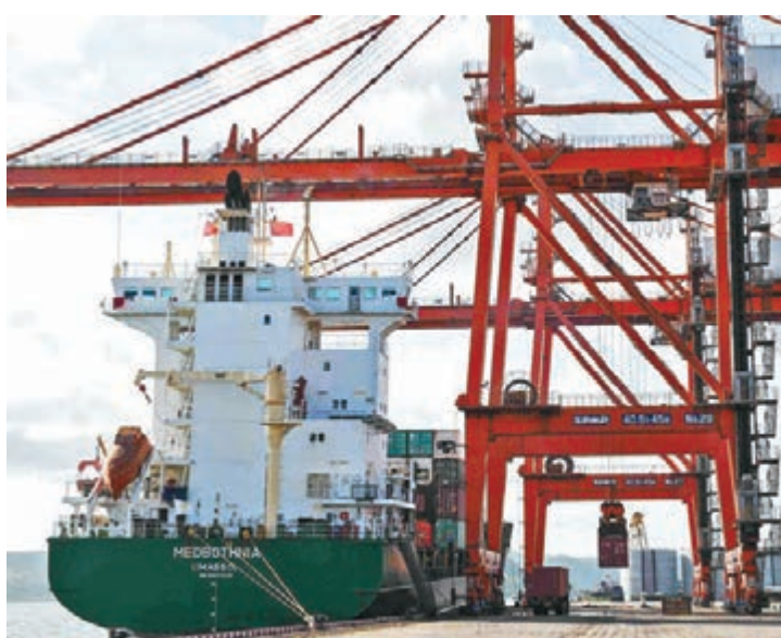
中國西部最大海港廣西防城港是中國距離東盟和馬六甲海峽最近的海港和西南中南地區最便捷、最經濟的出海大通道。

基金平均市盈率、標準差與近三年的貝他值為17.82倍、20.5%及1.09。資產地區分布24.5% 印尼、22.9% 新加坡、21.6% 馬來西亞、19.7% 泰國及8.9% 菲律賓。