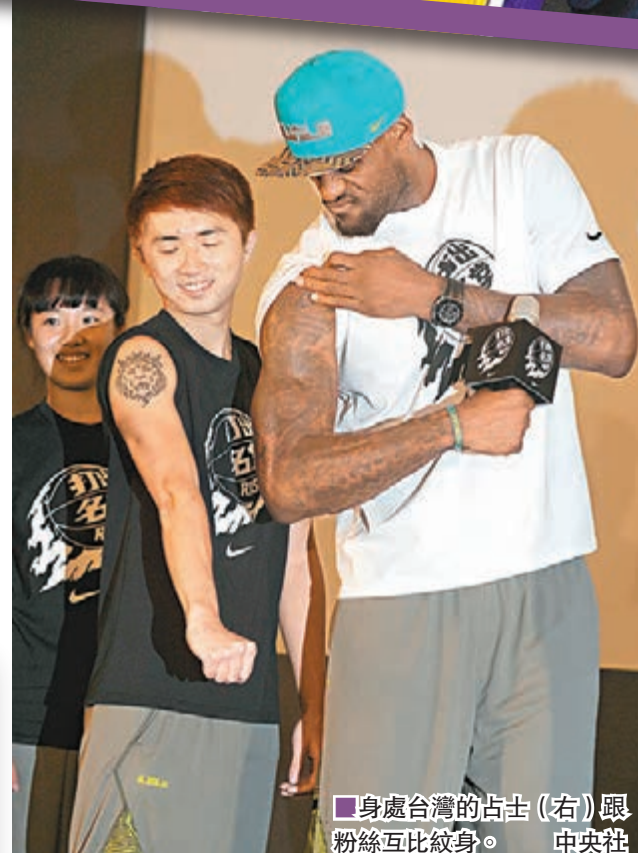
身處台灣的占士(右)跟粉絲互比紋身。