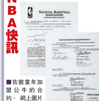
佐敦當年加盟公牛的合約。

公牛前球星「波神」米高佐敦於1997-98年賽季即第2次奪3連冠的最後一個球季所簽的3,300萬美元(約2.57億元)天價合約，昨日被拿作公開拍