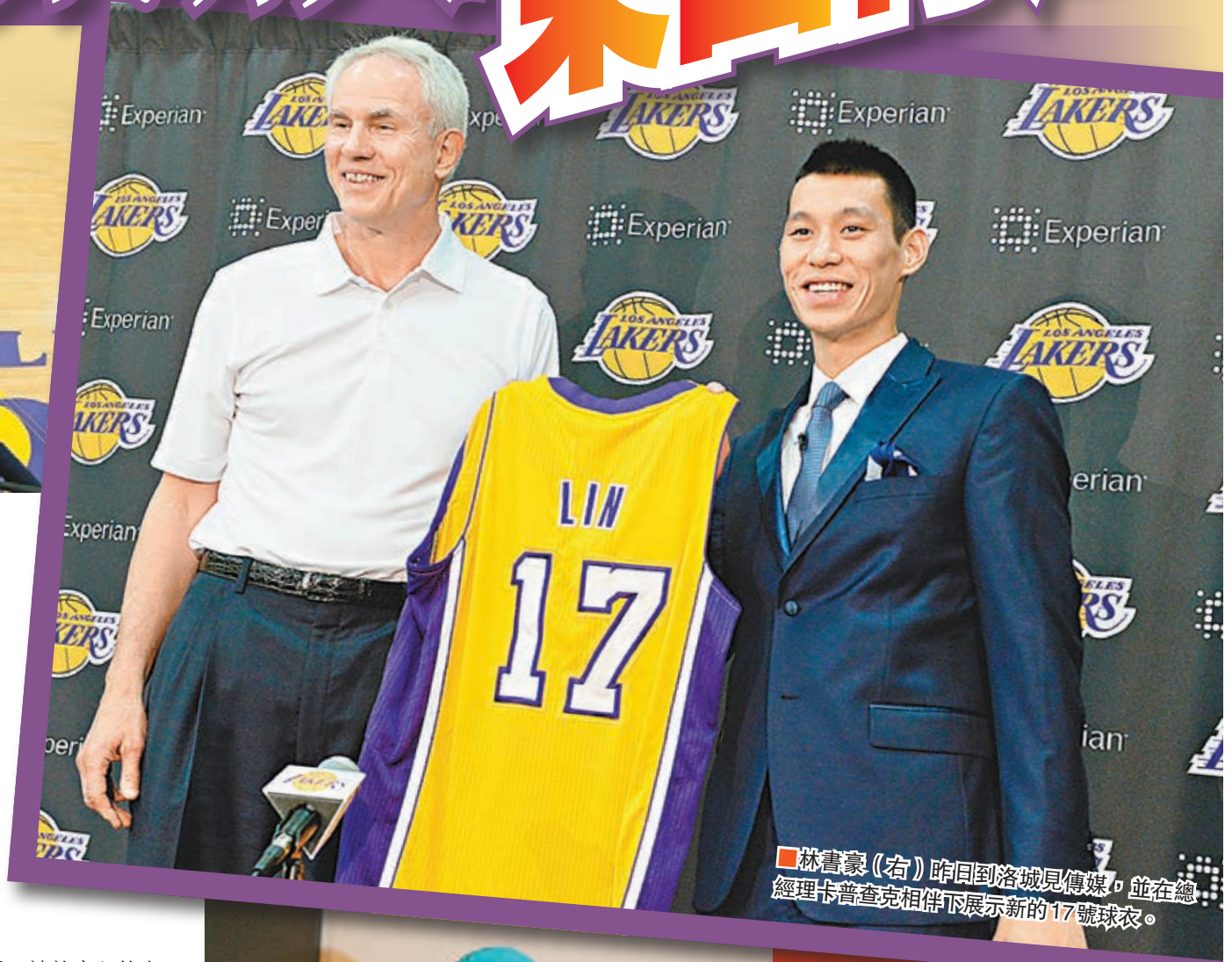
林書豪(右)昨日到洛杉磯見傳媒，並在總經理卡普查克陪同下展示新的17號球衣。