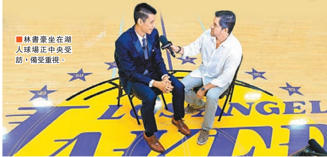
林書豪坐在湖人球場正中央受訪，備受重視。

華裔籃球球星林書豪，結束亞洲宣傳之旅後已返回美國，並於昨日出席新東家洛杉磯湖人的首個正式媒體活動。接過17號新球衣的「林瘋」，坦言只想努力重建「紫金王朝」，又指當年加盟紐約人時縱使掀起「瘋潮」，也令他壓力甚大，導致影響表現，故現在不想重蹈覆轍。