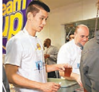
林書豪換過圍裙替街坊派飯。

盡內地和台灣球迷後，林書豪昨日終「鳥倦知還」，現身湖人的練習場豐田體育館，獲球隊總經理卡普查克送上全新17號球衣，作為歡迎他加盟的儀式。這亦是25歲的「林瘋」首度與當地傳媒見面，西裝骨骨的他精神醒目，看來亞洲之行沒讓他太疲累。