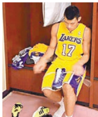
「林瘋」把穿新球衣的照片放到社交網站。網上圖片

華裔籃球球星林書豪，結束亞洲宣傳之旅後已返回美國，並於昨日出席新東家洛杉磯湖人的首個正式媒體活動。接過17號新球衣的「林瘋」，坦言只想努力重建「紫金王朝」，又指當年加盟紐約人時縱使掀起「瘋潮」，也令他壓力甚大，導致影響表現，故現在不想重蹈覆轍。