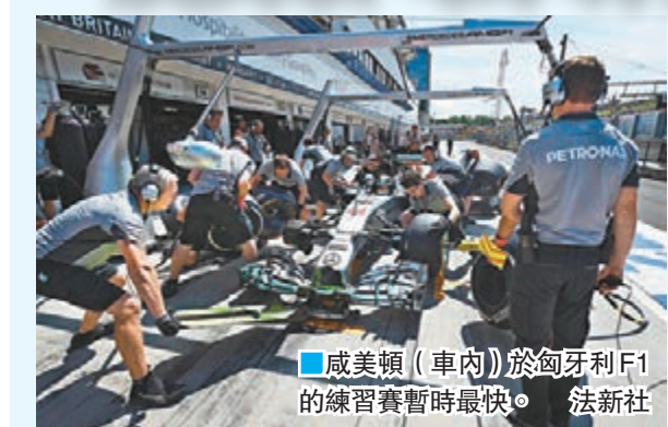
威美頓(車內)於匈牙利F1的練習賽暫時最快。

明日舉行的一級方程式賽車(F1)匈牙利站，力追榜首隊友羅斯保的平治車隊車手威美頓在練習賽中表現不俗，以1分25秒814的圈速暫時領先，羅斯保則稍慢0.183秒屈居第2。法拉利車隊一對車手拉高倫和艾朗素分列3、4位。