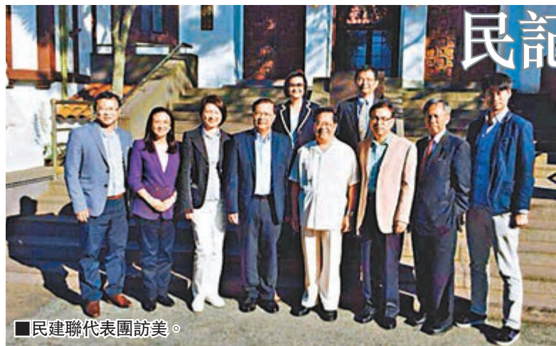
■民建聯代表團訪美。