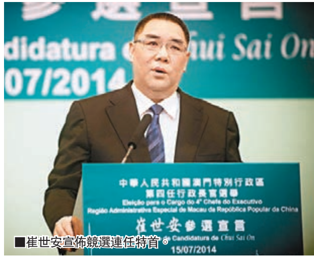
■崔世安宣佈競逐連任特首

於本月15日正式宣布參選第四任行政長官,尋求連任的崔世安,其競選代理人黃顯輝、競選辦公室主任梁少培等昨日前往行政長官選舉事務專區,向行政長官選舉管理委員會遞交了候選人提名表,包括331位選舉委員會委員的簽署,即未提名候選人的委員只剩下69人。