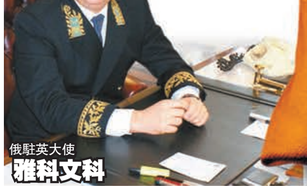
俄駐英大使 雅科文科