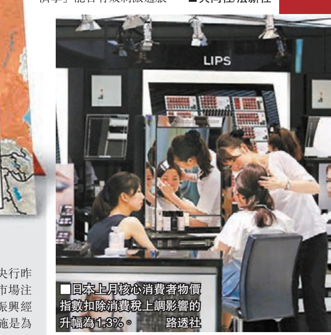
日本上月核心消費者物價指數扣除消費稅上調影響的升幅為1.3%。

日本昨日亦公布上月核心消費者物價指數按年升3.3%，較前一個月的3.4%升幅稍為放緩，扣除消費稅上調影響的升幅為1.3%，仍低於央行的2%目標，令市場再次質疑「安倍經濟學」能否有效刺激通脹。