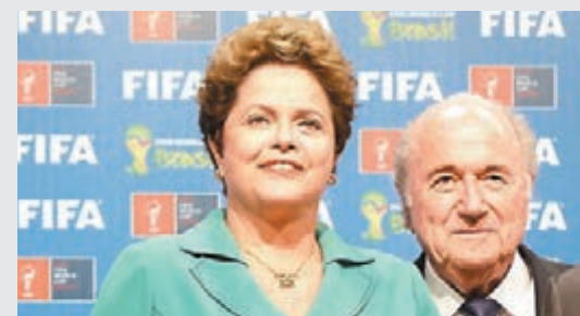
羅塞夫(左)與國際足聯主席白禮達早前合照。下圖為巴西央行。