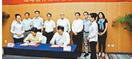
港鐵公司與重慶市政府簽署戰略合作諒解備忘錄。

香港文匯報訊 重慶市政府與港鐵公司近日就重慶市內一條或多條軌道交通線路的投資、建設和營運合作簽訂備忘錄,將參考港鐵公司的「鐵路加物業」發展模式,於軌道交通車站及車廠發展物業。