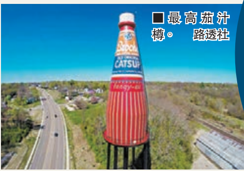
■最高茄汁樽。