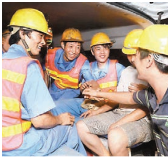
工友（右）向獲救的被困人員進行慰問。

香港文匯報訊 據新華社報道，昨日凌晨，雲南省文山壯族苗族自治州富寧縣「7·14」隧道坍塌事故中的14名被困人員成功獲救。被困人員獲救後被緊急送往富寧縣人民醫院。醫院將對被困人員進行全面體檢，然後根據情況進行治療護理。7月14日，中鐵隧道局在富寧縣板合鄉境內施工的雲桂鐵路富寧1號隧道橫洞輔助正洞進口方DK341+637M處發生坍塌，導致正在洞內施工的15名工人被困。目前，仍有1名被困人員失蹤，現場救援工作仍在繼續進行。