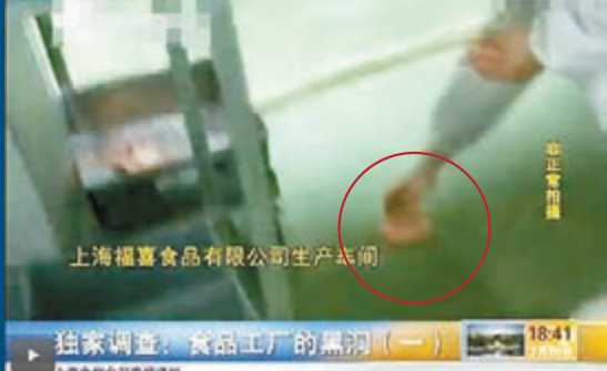
員工直接將掉地上的食材拿起來（紅圈示），重新放入生產線使用。