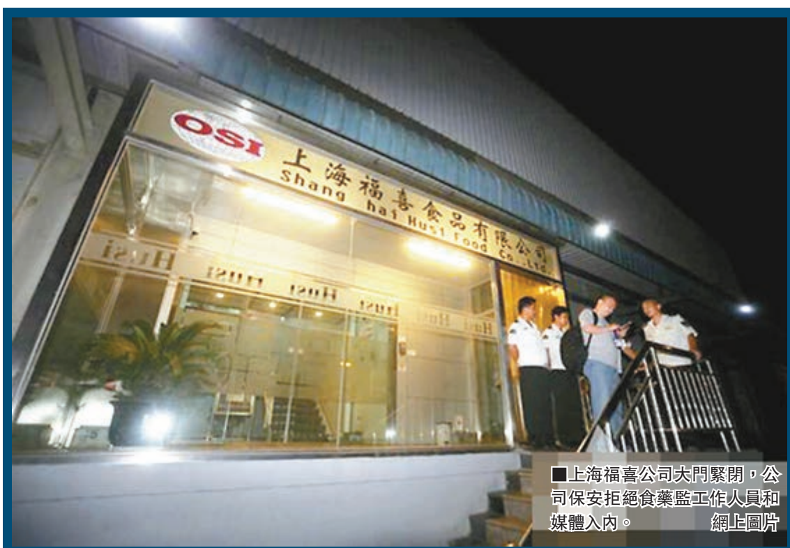
上海福喜公司大門緊閉，公司保安拒絕食藥監工作人員和媒體入內。

上海福喜食品有限公司(Husi Food)隸屬於美國OSI集團(OSI Group)，後者是世界上最大的肉類及蔬菜加工集團，也是麥當勞、百勝集團等重要的全球合作夥伴之一。上海福喜是上海市政府批准成立的一家美國獨資企業，其位於上海市嘉定區馬陸工業區內，主要從事為國際知名快餐連鎖店提供肉類、海鮮、米麵製作及蔬菜產品的生產和加工業務。OSI集團分別在山東乳山、河北廊坊、昆明和上海開設了工廠，其亞太總部位於上海。