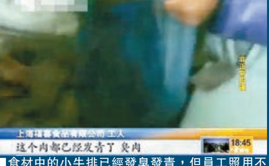
食材中的小牛排已經發臭發青，但員工照用不誤。