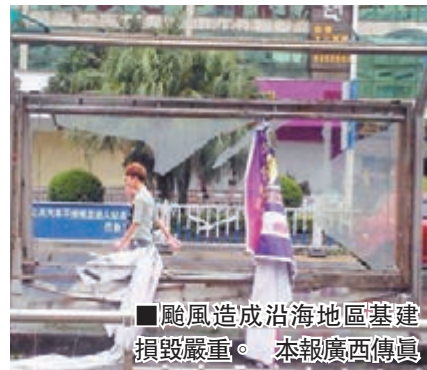
颱風造成沿海地區基建損毀嚴重。

香港文匯報訊（實習記者 唐琳 廣西報道）超強颱風「威馬遜」經過二天肆虐終於離開華南三省區，但據最新統計，「威馬遜」共造成海南、廣東、廣西三省區18人死亡，742.3萬人受災，3.7萬間房屋倒塌，直接經濟損失約為270億元人民幣。