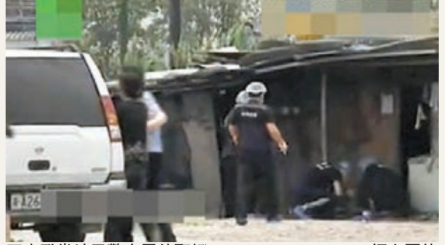
案發當地民警在屋外取證。