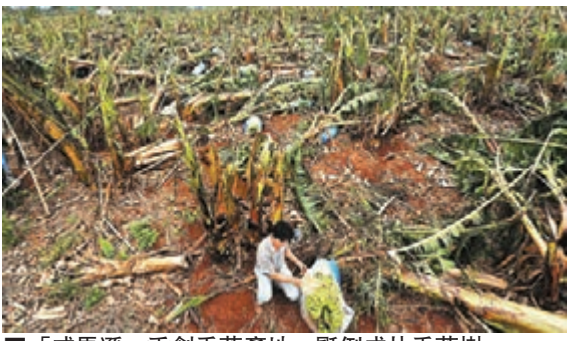
「威馬遜」重創香蕉產地，壓倒成片香蕉樹。

同樣遭颱風「威馬遜」掃過的廣西北海市房屋受損、停水停電，樹木被連根拔起，幾乎所有香蕉樹倒伏，受災嚴重。另外在南寧市壇洛鎮，這裡號稱「中國最大的香蕉之鄉」，「威馬遜」也導致該地香蕉和甘蔗受損嚴重。業內人士指出，「威馬遜」或將對中國甘蔗和香蕉的價格形成較大影響。該地有上百畝香蕉樹在大風「襲擊」下被整棵或連片吹倒。