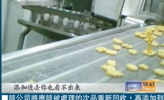
該公司將應該被處理的次品重新回收，再添加到生產線中。並稱「看不出來」。