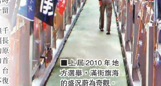
■上屆2010年地方選舉，滿街旗海的盛況蔚為奇觀。