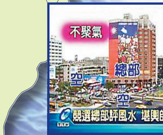
■有媒體特意分析競選總部的風水格局。

話你知 除了忙跑基層、推銷政見、拜票外，藍綠參選人競選總部的選址，也是費神費力的大事，是選戰中不可或缺的重要部分。這幾天，國民黨台北市長參選人連勝文競選總部選址新聞就被熱炒。