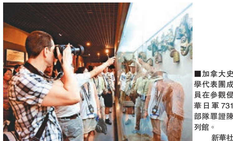
加拿大史學代表團成員在參觀侵華日軍731部隊罪證陳列館。