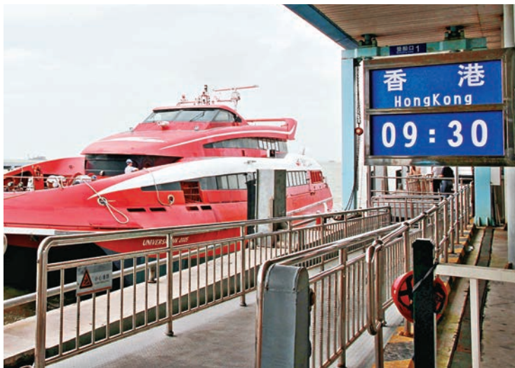
昨日上午9:30,深圳機場碼頭前往香港市區的首班船準時出發。