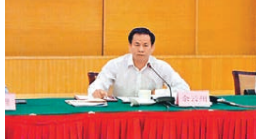
廣東省發改委副主任余雲州表示,將加快汕潮揭同城化建設。

交通基礎設施方面,將統籌汕頭、潮州、揭陽三市交通資源,強化交通的內外對接,互聯城鄉,構建共建共享,順暢快捷的現代立體交通網絡,力爭到2020年,形成汕潮揭一小時生活圈。