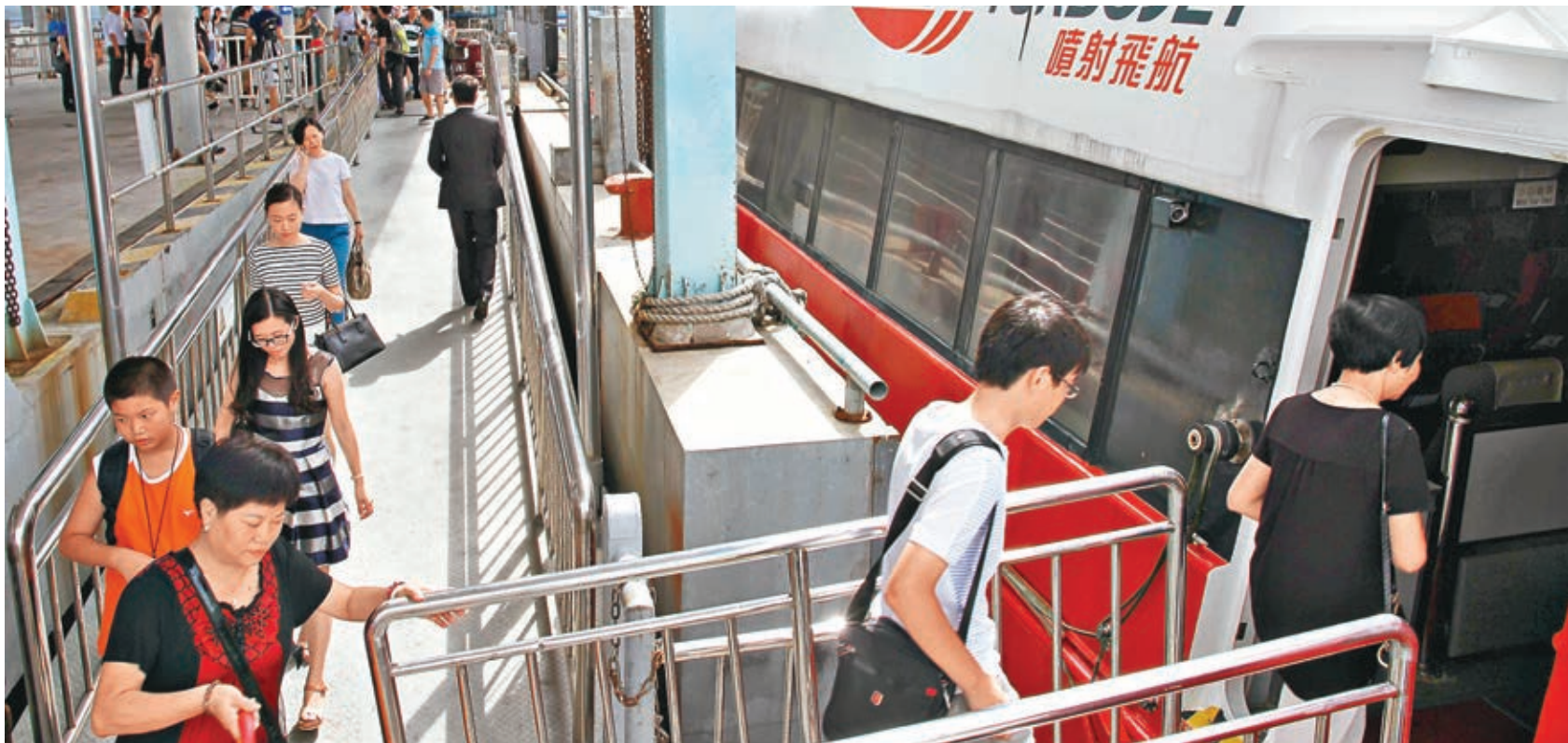
首批旅客有秩序地登船。

深圳機場碼頭負責人表示,此次新開香港上環港澳碼頭周六、日每日4班(往返各2班),而去年深圳機場碼頭實現旅客吞吐量近60萬人次。