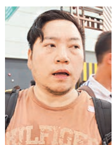
詹先生認為夜書市安排很好,讓他們能夠有更充裕的時間進場選購。

香港文匯報訊(實習記者 蔡雨詩)書展總是讓人沉醉書香的世界,周五、周六一連兩日舉行書展夜市,延長開放時間至午夜12時,並有憑完整票尾可免費進場優惠,上班族也都唔使趕,有充裕時間進場,不少市民更在飯後時間進場消費。