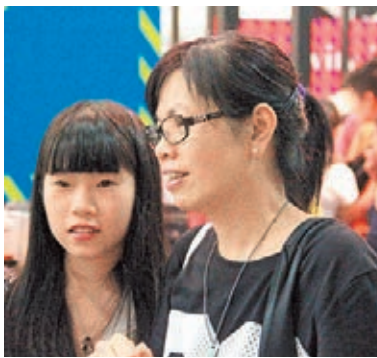
葉小姐說,若放工後才進場會較趕。

香港文匯報訊(實習記者 蔡雨詩)書展總是讓人沉醉書香的世界,周五、周六一連兩日舉行書展夜市,延長開放時間至午夜12時,並有憑完整票尾可免費進場優惠,上班族也都唔使趕,有充裕時間進場,不少市民更在飯後時間進場消費。