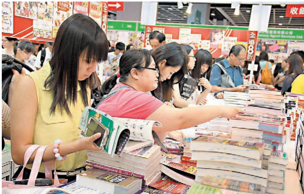
書展開夜市,丁財兩旺。有書商首4日營業額超預期,錄得按年約20%增長,情況理想令人滿意。

另外,中華書局亦指今年書展的反應不錯,同時人流理想,營業額亦達到預期。中華續指,有關香港的本地歷史及文化書籍最好賣,其次經典文學亦有不少捧場客,故同樣沒有減價的打算,希望新書繼續長賣長有。