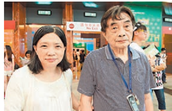
歐婆婆表示,由於長者行動較不方便,且下午人流較多,故晚上才進場逛逛。

長者:驚擠迫轉夜場 此外,不少人認為下午是黃金時段,人多擠迫,所以選擇晚上進場。歐婆婆表示,由於長者行動不方便,而下午人流較多,故她與丈夫在家午睡後,晚上才進場逛逛。 伍先生一家三口表示,由於下午有節目,故與家人晚上進場。他指:「夜書市好呀,可以睇晏少少,預鬆少少時間先進場。」一家人預算約1,000元內,主要為女兒選購一些小說、語文類等書籍和文具。