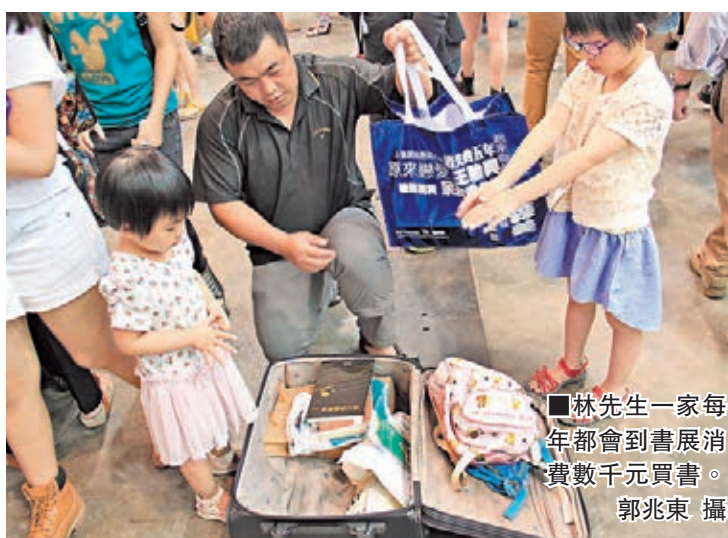
林先生一家每年都會到書展消費數千元買書。