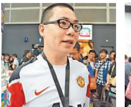
商務印書館職員表示,今年人流和銷售情況不錯,消費有明顯增長。