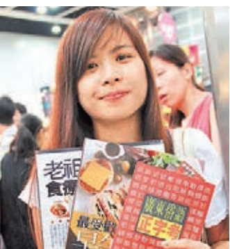
劉小姐指,買了數本外語及烹飪書,以便在工餘時間自我增值及消閒娛樂。