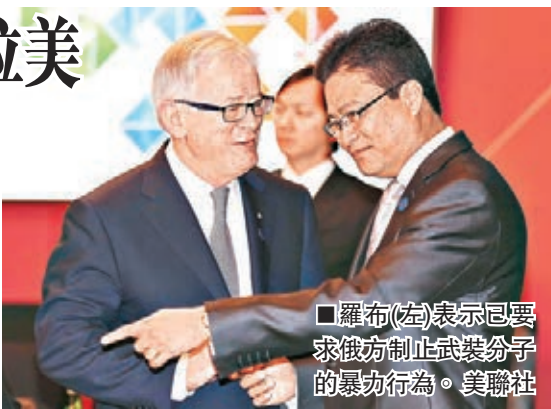
羅布(左)表示要求俄方制止武裝分子的暴力行為。

將考慮對俄實施貿易制裁。 G20領袖峰會11月將在澳洲昆士蘭舉行，昆士蘭省長紐曼稱，假如俄政府在有關馬航事件的獨立調查中表現不合作，俄總統普京屆時「可能不會獲邀」。