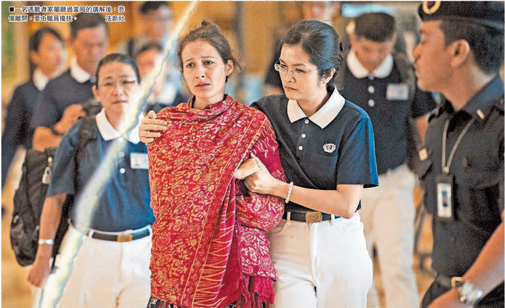
一名遇難者家屬聽過當局的講解後，悲傷離開，要由職員攙扶。

據「航空安全網絡」數據，連同今次馬航MH17客機墜毀慘劇，本年已有594人死於空難。翻查歷史，自1946年以來只有六個年頭(1955、2004、2008、2011、2012、2013)的全年航空事故死亡人數低於600人。近兩年來相關數字持續下降，成為最安全航空年，但馬航事故打破這良好紀錄，現在只是7月，若再有航空意外，今年死亡人數極可能超越600。