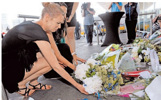
荷蘭機場外擺放了許多民眾送來的鮮花。