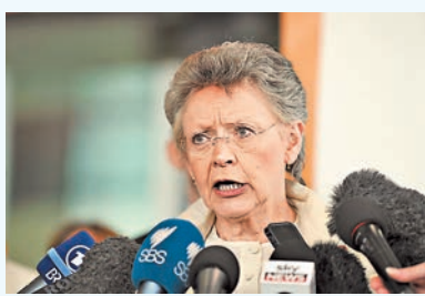
國際愛滋病協會會長西諾西

傳媒早前報道失事客機載有108名愛滋病專家，前往澳洲墨爾本出席國際愛滋病研討會。國際愛滋病協會會長西諾西昨日澄清，機上已證實有6名愛滋病專家，數字可能隨進一步核實而上升，但相信實際罹難專家人數少於先前報道。她表示，業界會繼續致力研發治療愛滋病藥物，以告慰罹難者在天之靈。