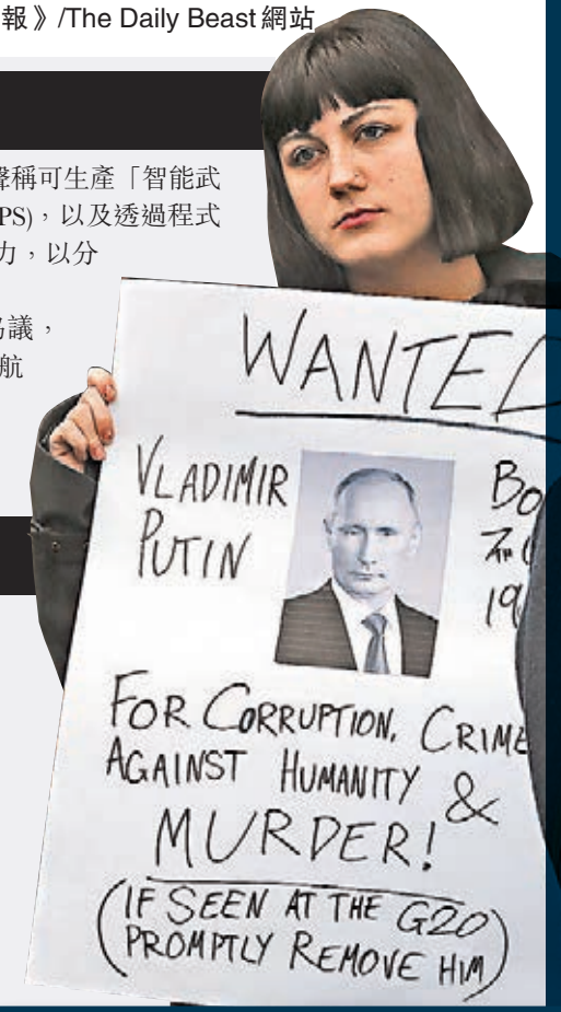
澳洲有女子舉起紙牌，指責俄羅斯總統普京是兇手。