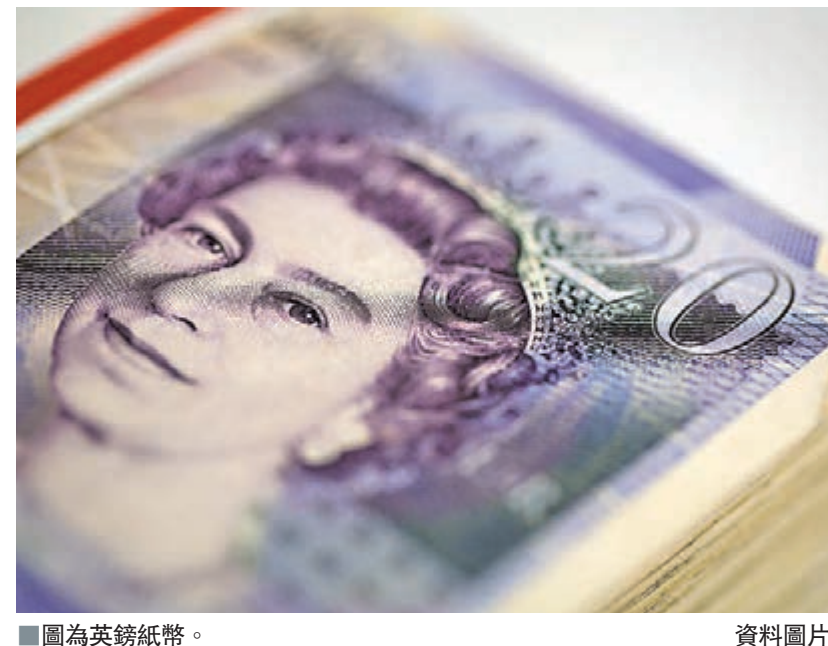
圖為英鎊紙幣。資料圖片

中港酒店：九龍尖沙咀白加士街1-11號1 & 2樓全層 電話：2730 1113 傳真：2723 5398 比華利酒店：香港灣仔駱克道175-191號京城大廈4樓全層 電話：2507 2026 傳真：2877 9277 網址：www.bchkhotel.hk