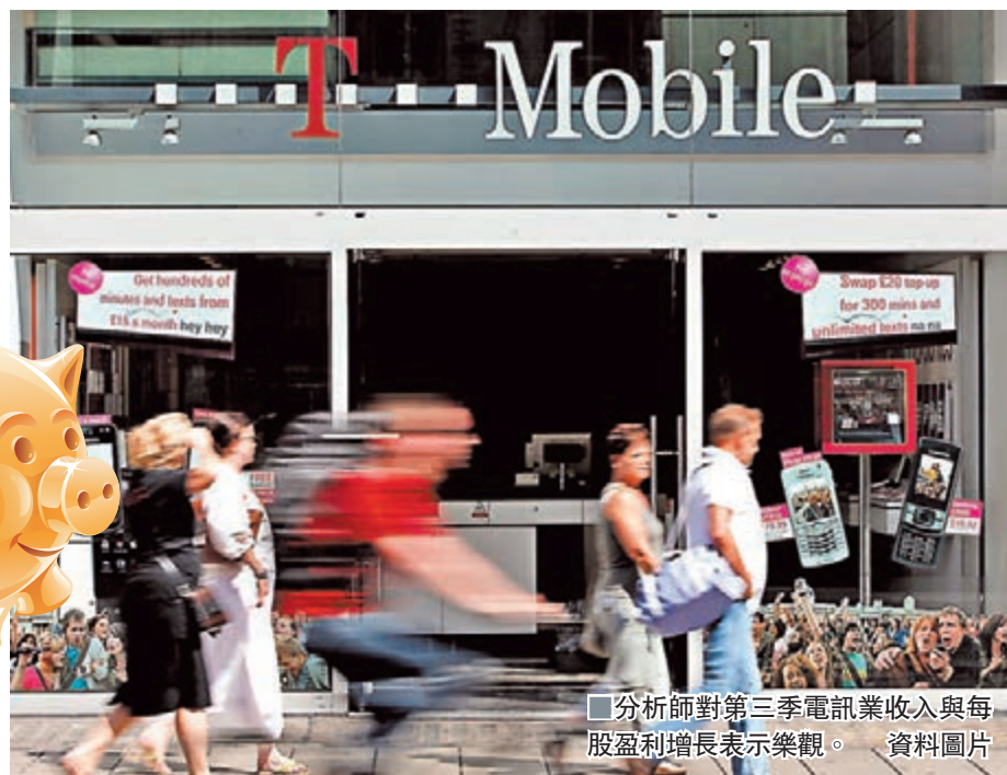
分析師對第三季電訊業收入與每股盈利增長表示樂觀。資料圖片