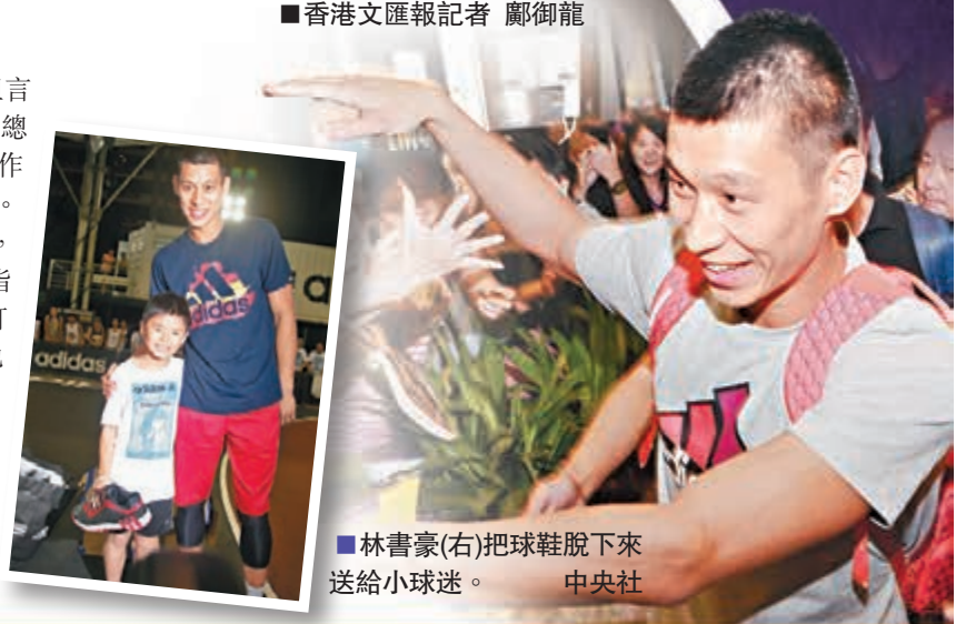
■林書豪(右)把球鞋脫下來送給小朋友。