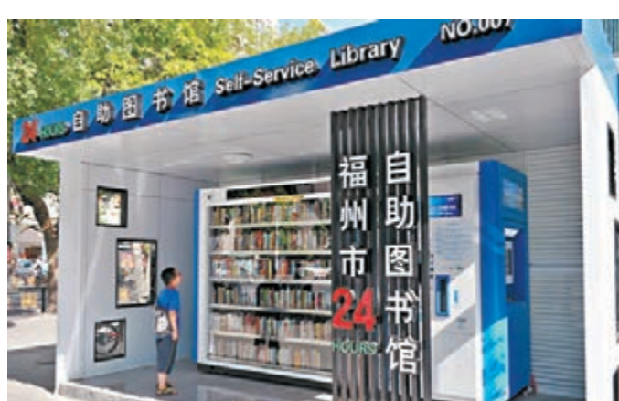
福建 24小時自助圖書館 福州11個城市街區24小時自助圖書館近日正式投入試運行。市民任何時候只要到就近的自助圖書館,通過自助機,即可自助申辦讀者證,享受圖書查詢、借書還書、續借續還等圖書館的基本服務功能。圖為福州市民在24小時自助圖書館前借書。

香港文匯報訊(記者 濮沁 四川報導)位於海拔3535米的紅原機場將於8月底正式通航,「環紅原機場旅遊經濟圈」將覆蓋黑水、若爾蓋、阿壩、馬爾康、理縣等9個縣,遊客可在機場享受落地自駕、異地還車等服務。此外,紅原機場通航後將與九寨機場相呼應,遊客能在4天內遊完紅原草原、達古冰川和九寨黃龍。紅原機場於上月5日試飛成功。機場建成通航後,阿壩州集鐵路、公路、航空為一體的綜合交通運輸網絡將初步形成,全域旅游成為現實。機場覆蓋的經濟圈內將能給遊客嘉絨藏族文化、草原風情、安多藏族風情文化、冰山彩林以及養生休閒度假等多層次的旅遊體驗。紅原機場位於四川省阿壩州紅原縣龍日壩,屬於高原機場,機場等級為4C,可以起降空客319等機型。機場初期將開通成都-紅原的往返航線,空中飛行時間只需40分鐘,單程價格預計在1300元左右。未來還將開通重慶、西安、拉薩航線。