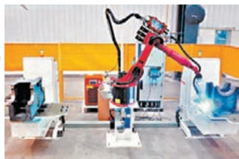
■裝備製造企業泰富重工第一個焊接機器人投入使用，效率比人工提高了4倍。 本報湖南傳真

香港文匯報訊(記者 董曉楠、易新湖南報道)湖南日前發佈《關於進一步加快推進新型工業化的決定》(下稱《決定》),去年湖南全省全部工業增加值超萬億元,佔地區生產總值的40.8%;《決定》頒佈力爭到2017年,湖南全部工業增加值超過15000億元,打造1個以上主營業務過萬億元的大產業、10個技工貿收入過千億元的大園區、10個銷售收入500億元至1000億元的大企業,有助促進全省新型工業化發展。