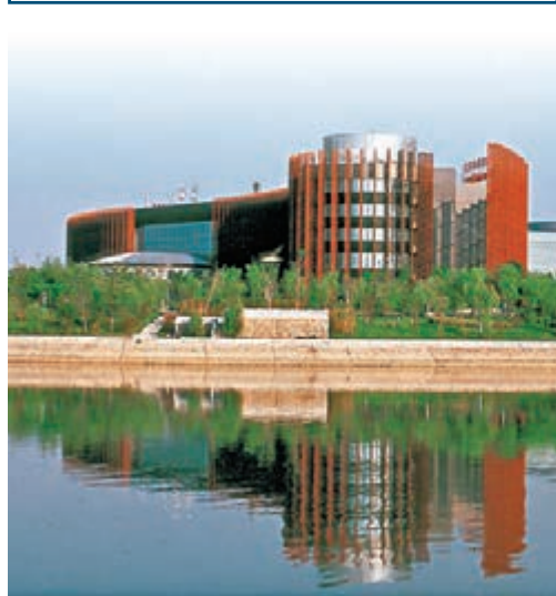
■西安瀋陽生態區是歐亞經濟論壇永久會址所在地。 本報西安傳真

香港文匯報訊(記者 胡秦玉 西安報道)為了加快絲綢之路經濟帶新起點建設,推動向西開放戰略,陝西將在西安瀋陽生態區先行設立歐亞經濟綜合園區核心區,率先開展歐亞經濟綜合園區試點工作,打造歐亞經濟樞紐,以加強與絲綢之路沿線各國及重要城市在政治、經濟、文化等領域的交流與合作。