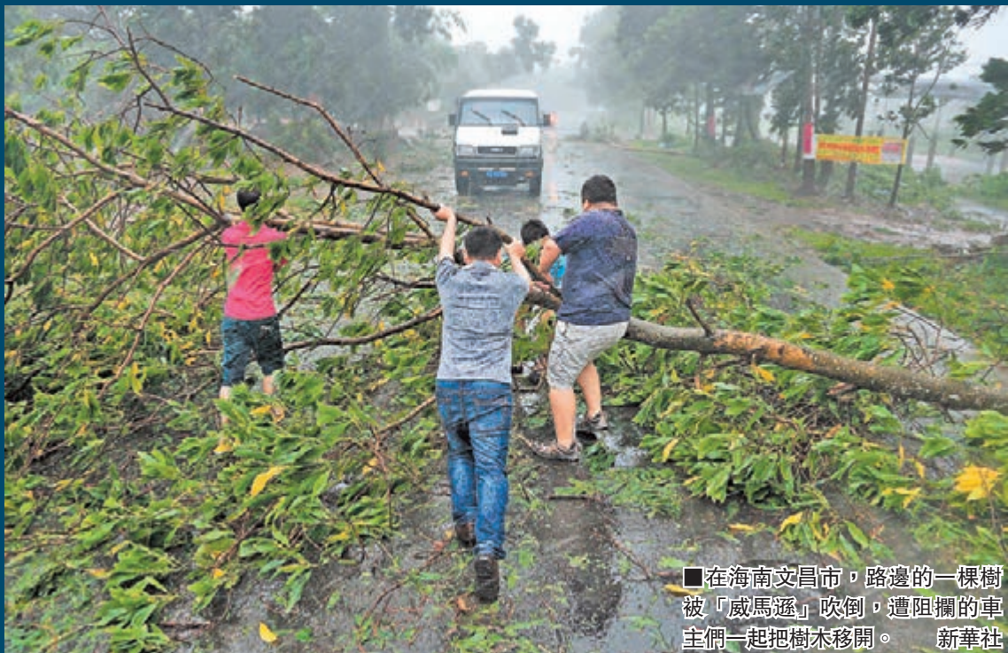
在海南文昌市,路邊的一棵樹被「威馬遜」吹倒,遭阻攔的車主們一起把樹木移開。

據了解,「威馬遜」並非第一個在中國連續三次登陸的颱風。2003年9月颱風「杜鵑」曾三次登陸廣東,2004年8月颱風「艾利」曾三次登陸福建,均為登陸地區帶來不小影響。