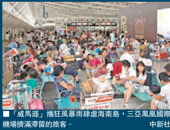
「威馬遜」攜狂風暴雨肆虐海南島,三亞鳳凰國際機場擠滿滯留的旅客。