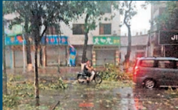
廣東徐聞縣受颱風影響,交通癱瘓。