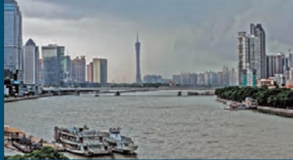
「威馬遜」逼近,廣州城區迎來強降雨,暴雨來臨前的珠江兩岸黑雲密布。