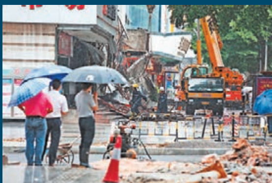
羅湖商廈簷篷倒塌,造成3人死亡。

香港文匯報訊(記者郭若溪、實習記者徐惠平深圳報道)颱風「威馬遜」昨日襲擊深圳,傾盆暴雨導致羅湖國際商品交易大廈一樓發生石屎簷篷倒塌事件,造成3死12傷。據專家初步判斷,事故原因為簷篷支座部分鋼筋銹蝕,遭暴雨衝擊破壞,致一樓簷篷局部倒塌。目前,事故原因還在進一步調查中。昨晨11時許,國際商品交易大廈一樓石屎簷篷突