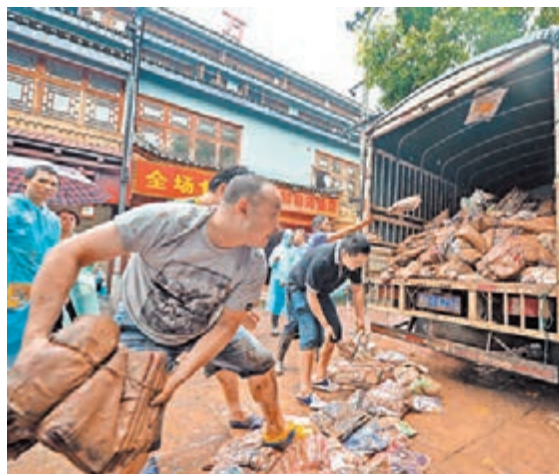
鳳凰古城一處商戶17日在清理轉運被洪水浸泡過的物品。

香港文匯報訊(記者李青霞、實習記者肖茜報道)湖南鳳凰縣「7·15」洪災,由於降雨量大、時間持續長、範圍廣、雨勢急,造成全縣河流水位暴漲,致沿江商戶和客棧低層被淹,古城部分街道進水。據鳳凰縣旅遊局介紹,洪災期間接聽遊客求助電話166個,成功處理遊客訴求312人次,無條件退票10,325張,金額達97萬元,與組團社及時對接聯繫,勸返遊客33,187人次。