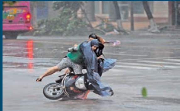
廣東湛江徐聞縣城一輛行駛中的電單車被強風吹倒。新華社