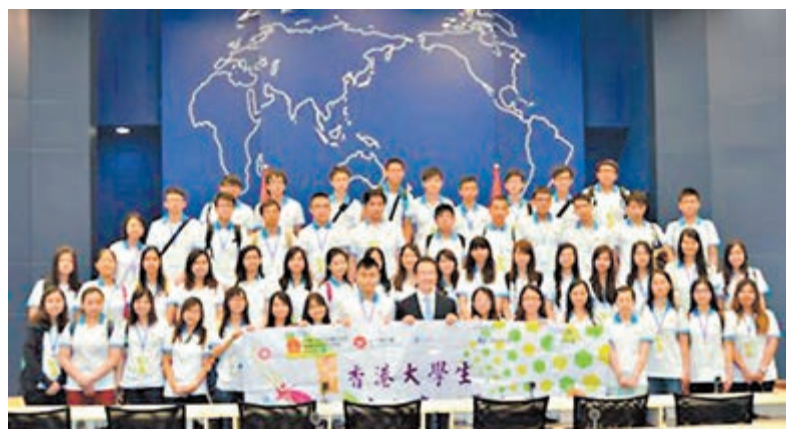
外交部發言人洪磊與香港大學生合影。

香港文匯報訊(記者 鄭治祖)外交部駐港特派員公署於7月上中旬組織首屆香港大學生「外交之旅」交流團,和第四屆香港大學生「外交之友」夏令營近百名學生前往北京、天津和南京參訪。香港大學生滿懷著對國家