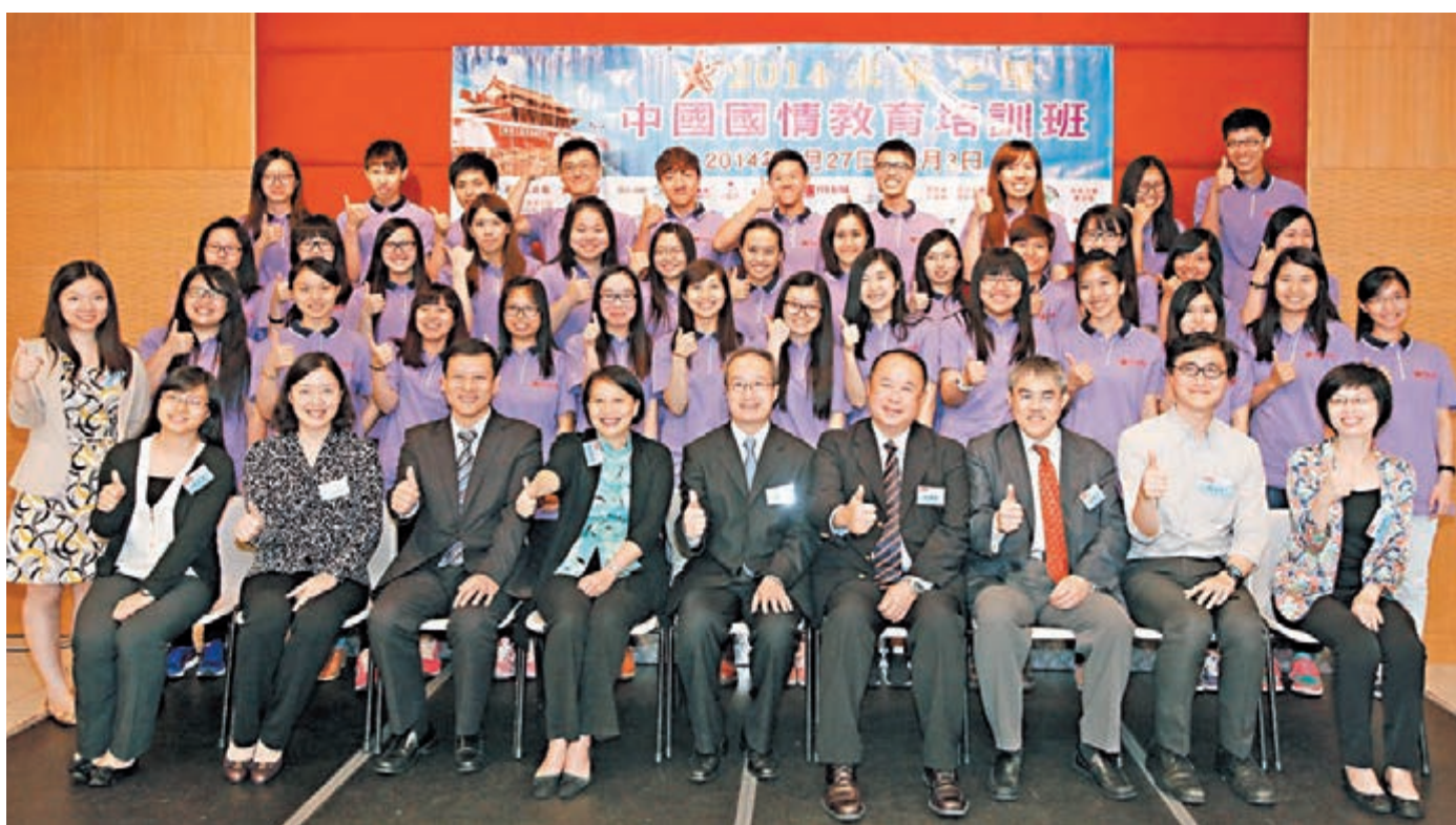
近百名香港大專生參加「2014未來之星——中國國情教育培訓班」,將赴京進行8天交流。出發授旗禮昨舉行。

香港文匯報訊(記者 鄭伊莎)由香港文匯報及「未來之星」同學會主辦的「2014未來之星——中國國情教育培訓班」昨日舉行出發授旗禮。近百名來自不同大專院校的學生將於本月底上京交流8天。這批「未來之星」除遊覽當地名勝,到訪外交部、解放軍軍營、人民大會堂外,並會到清華大學上課,課程內容涵蓋國家法治、經濟、外交與教育等多個範疇,又會與內地大學生交流對談,增進學生對國家發展機遇與挑戰的認識,協助他們建立國民身份認同感和責任感。