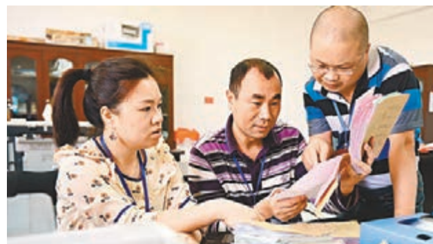
■地方紀委檢查組工作人員在財政所檢查公務接待原始票據。資料圖片