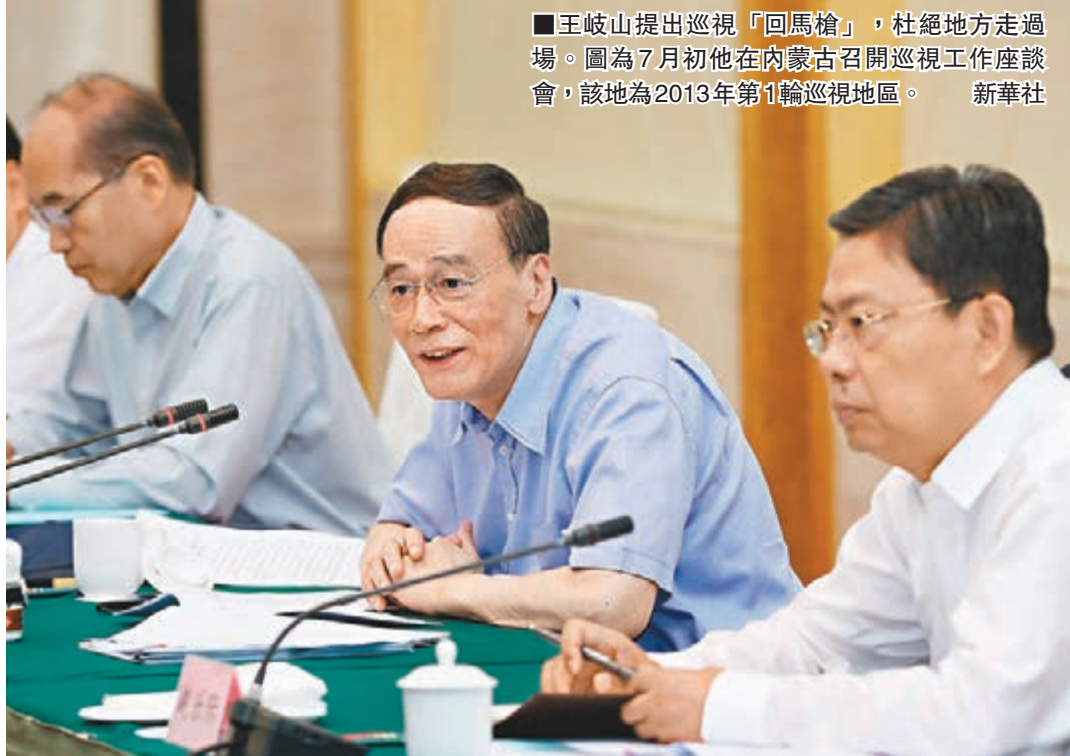
■王岐山提出巡視「回馬槍」，杜絕地方走過場。圖為7月初他在內蒙古召開巡視工作座談會，該地為2013年第1輪巡視地區。

不歇息反腐 貪官難遁形 他還表示，「回馬槍」顯示反腐只有進行時、沒有完成式，令不法分子無處遁形。另外，這也是針對巡視地區和單位整改不力甚至「走過場」提出的，有助於杜絕巡視地區和單位部分幹部的僥倖心理，加強對巡視後整改落實情況的監督檢查，提升巡視工作的權威性。