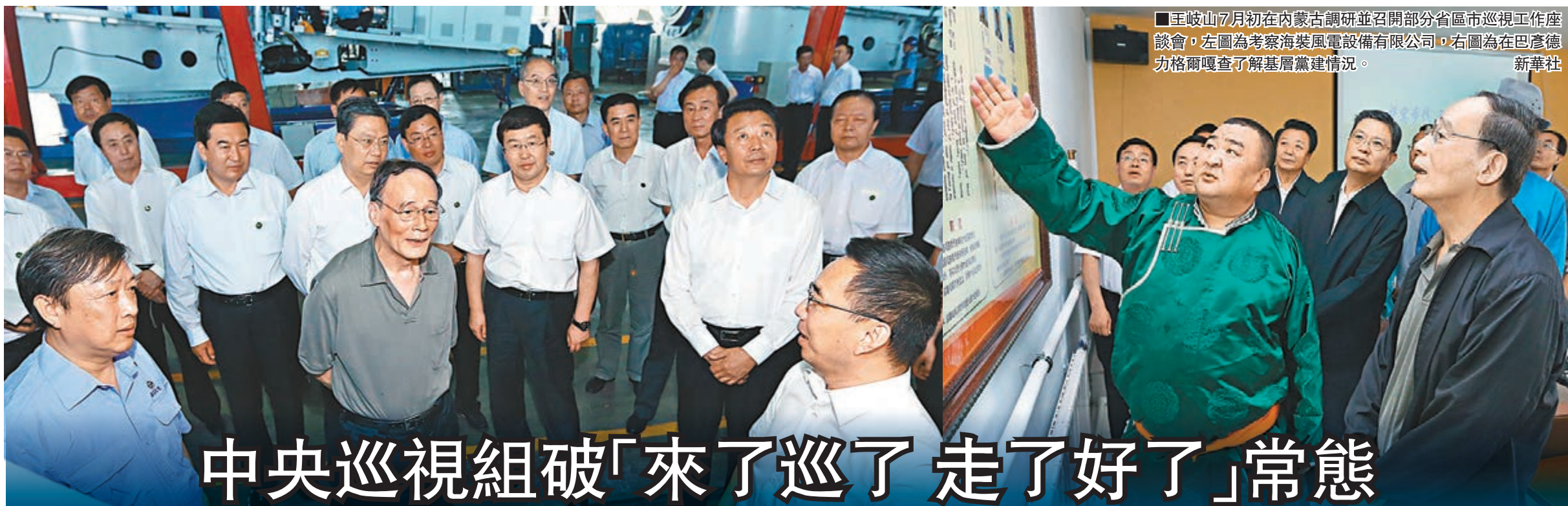
■王岐山7月初在內蒙古調研並召開部分省區巡視工作座談會，左圖為考察海裝風電設備有限公司，右圖為在巴彥德力格爾調查了解基層黨建情況。