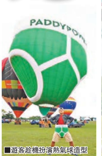
遊客趁機扮演熱氣球造型