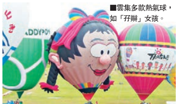
雲集多款熱氣球，如「孖瓣」女孩。

熱氣球嘉年華今年踏入第4屆，有9類合熱氣球及十位取得飛行證書的飛行員進行飛行表演，九個熱氣球包括來自英國、巴西、德國、澳洲、美國及台灣，造型設計獨特，英國的造型球「孖瓣」女孩及「幸運褲」，幸運褲實為一條巨型綠色三角褲；台灣的造型球是彩虹；來自巴西的「大黃蜂」，十分可愛，每天提供7至9顆熱氣球給遊客體驗。