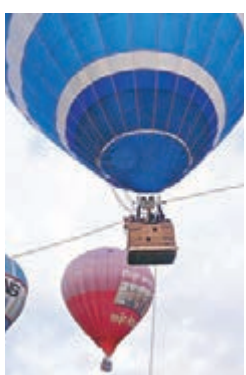
熱氣球繫留飛行體驗

熱氣球繫留飛行體驗是以繩子固定熱氣球定點升降，上升至一定的高度讓民眾體驗熱氣球升空的感覺，不會飛離現場，較安全，但喜歡刺激的男士可能嫌「小兒科」。