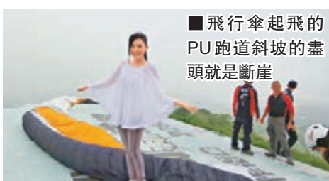
飛行傘起飛的PU跑道斜坡的盡頭就是斷崖

遊客可以搭乘台鐵於「鹿野站」下車後，沿著中正路直行約3分鐘即達到車站轉搭「台灣好行—縱谷鹿野線」專車前往配合熱氣球嘉年華活動會場。台鐵局7月16日至8月10日列車加開增停鹿野班次。查詢：官網 http://www.railway.gov.tw