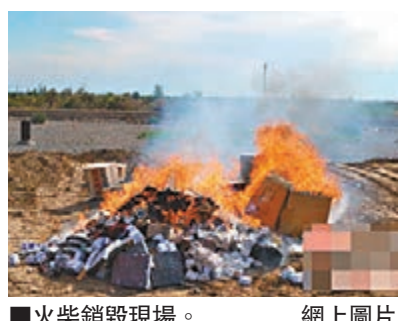
■火柴銷毀現場。

香港文匯報訊（記者 敖敏輝 廣州報道）廣州市公安局昨日對外通報，對一名舉報涉恐疑犯的市民予以重獎，獎勵人民幣3萬元。據悉，廣州警方根據該市民的舉報，成功抓獲2名逃竄至廣州的新疆籍涉恐疑犯。這是廣州警方第二次對舉報涉恐犯罪的市民進行獎勵。此外，本月12日，廣州市公安局已成立反恐大隊。