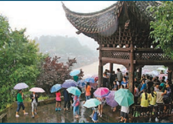
■鳳凰古城經一夜暴雨，沅江水位上漲，部分商舖被淹，人們在高處觀望水情。