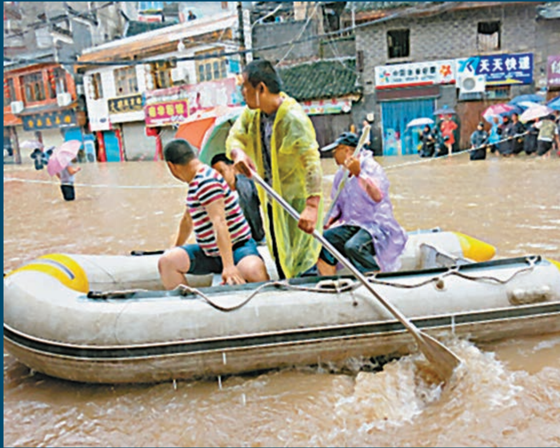
■鳳凰古城公司員工乘皮划艇在古城內救助受困群眾。

災情發生後，鳳凰縣委、縣政府立即啟動抗災救災一級應急預案，組織全縣幹部群眾抗災救災，及時轉移受災群眾和臨江客棧遊客。目前，鳳凰縣境內的沅江河、白泥河、萬溶江等河下游沿岸及古城內沿河近五萬群眾和遊客得到轉移，並在縣城設立多處臨時安置點。 鳳凰古城旅遊有限公司人員透露，目前整個鳳凰古城的旅遊都已停止。受水災影響，原定19日至21日舉行的鳳凰古城偶遇節可能要延後。湖南省氣象局預計昨今兩日為湖南省降水最強時段，大暴雨襲擊湘中以北。 據湖南省防汛抗旱指揮部通報，截至昨日，強降雨造成湖南8個市州72萬人受災，其中，沅江鳳凰站水位超歷史紀錄。湖南省水利廳、省防指進行緊急部署，轉移群眾14.94萬人，直接經濟總損失4.6億元，暫無人員傷亡報告。