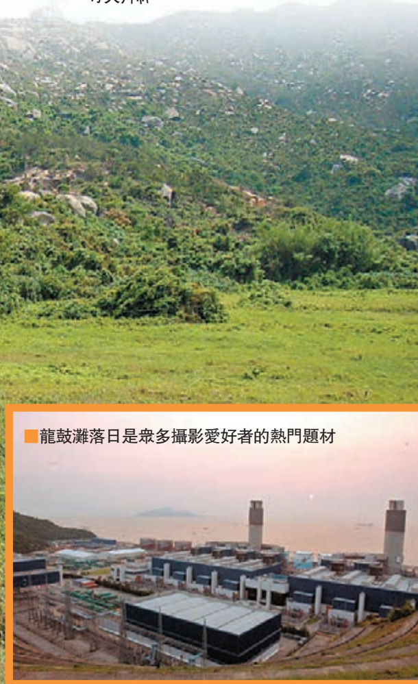
龍鼓灘日落是眾多攝影愛好者的熱門題材

推薦過可以與大海親密接觸的衝浪聖地以及潛水勝地之後，今期，小編將推薦一個適合與愛人、家人盡情漫步，互相依偎着，在蝴蝶伴舞、海豚奏樂下靜看日落的沙灘——龍鼓灘。