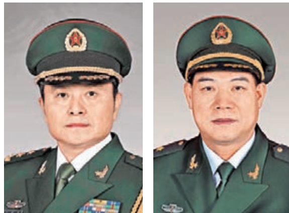
■王曉軍中將 ■譚本宏少將