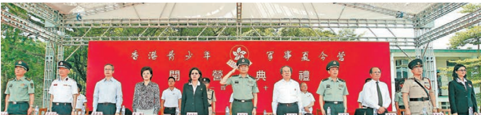
■駐港部隊參與主辦第十屆「香港青少年軍事夏令營」開營典禮。

「香港青少年軍事夏令營」由解放軍駐港部隊、群力資源中心和教育局合辦，包括本屆學員在內，至今共有2,025名青少年參加。駐軍希望在履行防務職責的同時，加強與香港社會各界的溝通和交流，為本港做有意義的事。