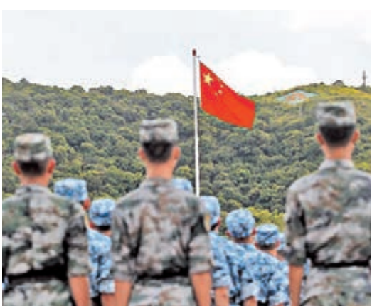
■開營典禮舉行升旗儀式。