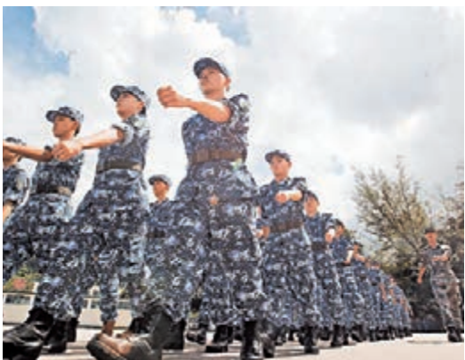
■學員們精神抖擻，準備好迎接軍事夏令營的訓練和挑戰。