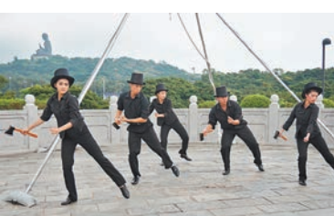
▲馬戲團眾成員共同演繹港式喜劇幫派群舞。

主題之一的 A-GO-GO 代表了一個時代的新潮與前衛，像《我愛阿哥哥》這類在上世紀六十年代末蔚然成風的青春電影，正是香港電影本土化踏出第一步的象徵。表演者們身穿色彩繽紛且以幾何圖案裝飾的「奇裝異服」，伴隨快節奏的音樂時而肆意舞蹈，時而在空中架上旋轉翻騰，盡情揮灑青春的熱情奔放。隨後是功夫武術表演二人對決，讓人不禁回想起那些曾出現於香港功夫電影裡的各位「高手」，他們憑藉一舉一腳的真功夫，在七、八十年代頻出佳作，引領時代電影潮流。