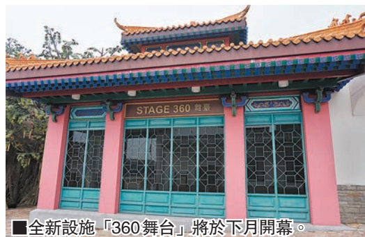
▲全新設施「360舞台」將於下月開幕。

昔時漫步於昂坪市集，山間綠蔭蔥蔥映襯着古雅的中式建築群，琳瑯滿目的特色商舖總令人流連忘返，無論是極富中國特色的古董珍寶、木刻石雕、戲曲飾物、唐裝繡鞋，還是東南亞特式筷子、精選創意禮品或寓意好運和幸福的招財貓，皆可於此處覓到蹤影。若逛街購物感到疲累肚餓，市集內各色中西美饌將是小憩兼「醫肚」的不二之選；與家人好友圍坐而坐，或品嚐傳統潮州佳餚，或分享經典日式料理，或來頓美味港式三文治，或細味香濃咖啡，仰望時觀天壇大佛，談笑間任微風拂面，盡享「偷得浮生半日閒」的愜意。今夏再度置身於昂坪市集，美景風情依在，新鮮內容更為豐富多彩：既可於「舞吧！香港電影」主題表演中找尋關於港片的集體回憶，又可隨「奇幻綠布影片」和「電影特技化妝」活動步入動作電影世界，而預計於下月開幕的新設施「360舞台」及「360動感影院」又將為市集增添更多創新科技元素和文化藝術氣息。