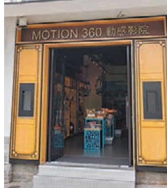
▲「360動感影院」位置現時暫為創意禮品店。