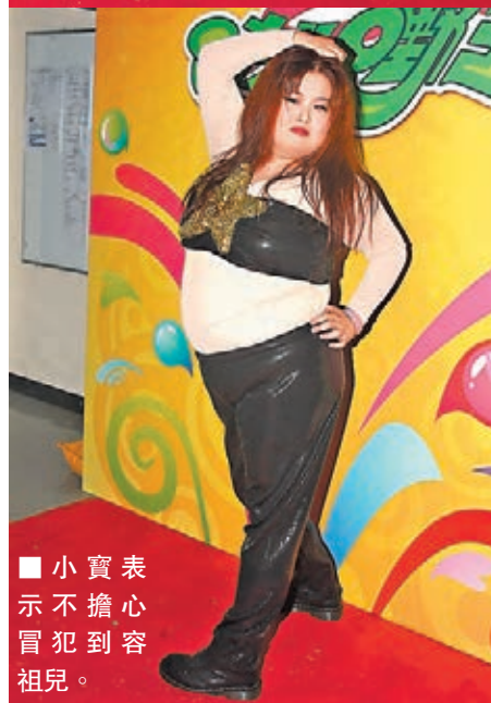
■小寶表示不擔心冒犯到容祖兒。