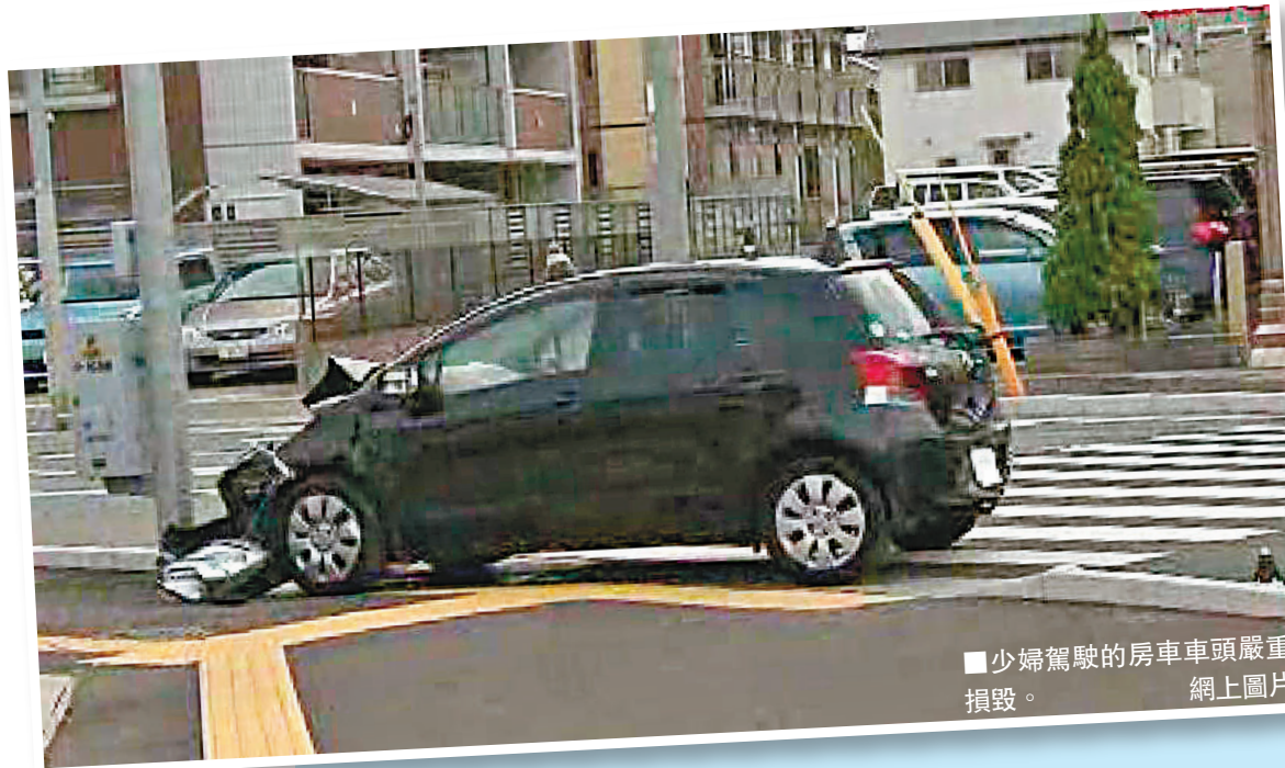
少婦駕駛的房車車頭嚴重損毀。