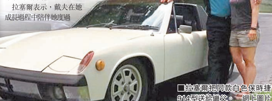
拉塞爾把同款白色保時捷 914 型送給繼父。