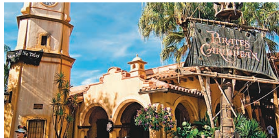
園方事後關閉機動遊戲進行檢查。網上圖片

玩樂時也要時刻警惕，否則樂極生悲。一名 40 歲英國男子上周四到美國佛羅里達迪士尼世界遊玩時，在「加勒比海盜船漂流」遊