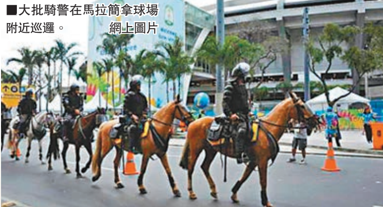
大批騎警在馬拉拿拿球場附近巡邏。網上圖片

巴西世界盃將於香港時間明日凌晨在里約熱內盧舉行領事將親臨現場觀戰。當局在里約部署逾2.5萬名軍警戒終極一戰，德國總理默克爾及俄羅斯總統普京等逾10國領袖將親臨現場觀戰。當局在里約部署逾2.5萬名軍警戒終極一戰，德國總理默克爾及俄羅斯總統普京等逾10國領袖將親臨現場觀戰。當局在里約部署逾2.5萬名軍警戒終極一戰，德國總理默克爾及俄羅斯總統普京等逾10國領袖將親臨現場觀戰。