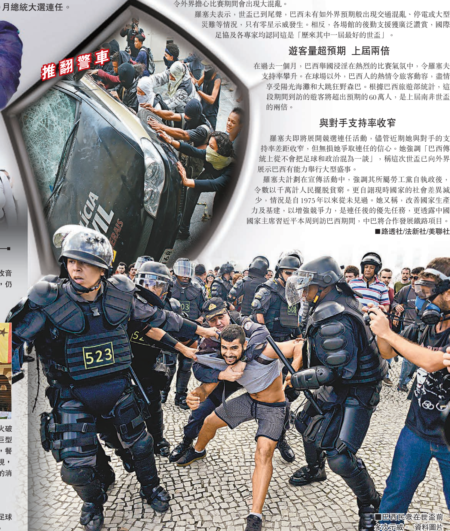
巴西民眾在世盃前多次示威。資料圖片