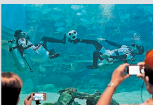
菲律賓水族館預先上演德國阿根廷大戰。

巴西和阿根廷這對冤家近年都面對民怨高企的問題，尤以後者情況更為嚴重。今屆世界盃，兩國領導人都希望借勝利刺激支持度，其中阿根廷政府更幾乎用盡所有方法，誓要令足球深入每個國民的思想，讓他們忘記足球以外的事物。