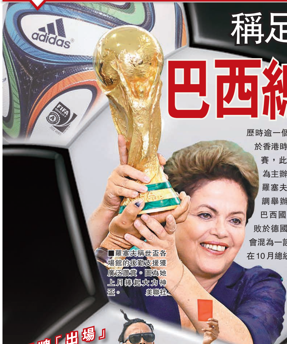
羅塞夫稱世盃各場館的後勤支援獲廣泛讚賞。圖為她上月舉起大力神盃。