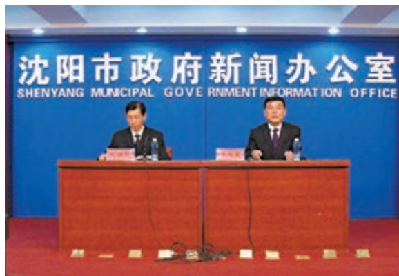
瀋陽市上半年外經貿運行情況新聞發佈會現場。

第三點,香港在樓宇經濟,包括CBD,研發總部、金融開放等多方面都值得我們學習,這對我們的主城區在轉型、升級的過程當中,能夠更好利用現有的樓宇和已