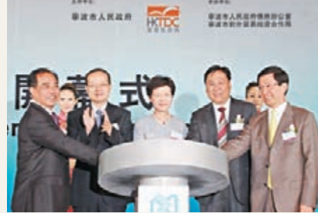
圖為2013甬港經濟合作論壇在香港舉行。

香港文匯報訊(實習記者 周方怡 寧波報導)從2014甬港經濟合作論壇組委會獲悉,2014甬港經濟合作論壇將於7月31日至8月2日在寧波舉行。