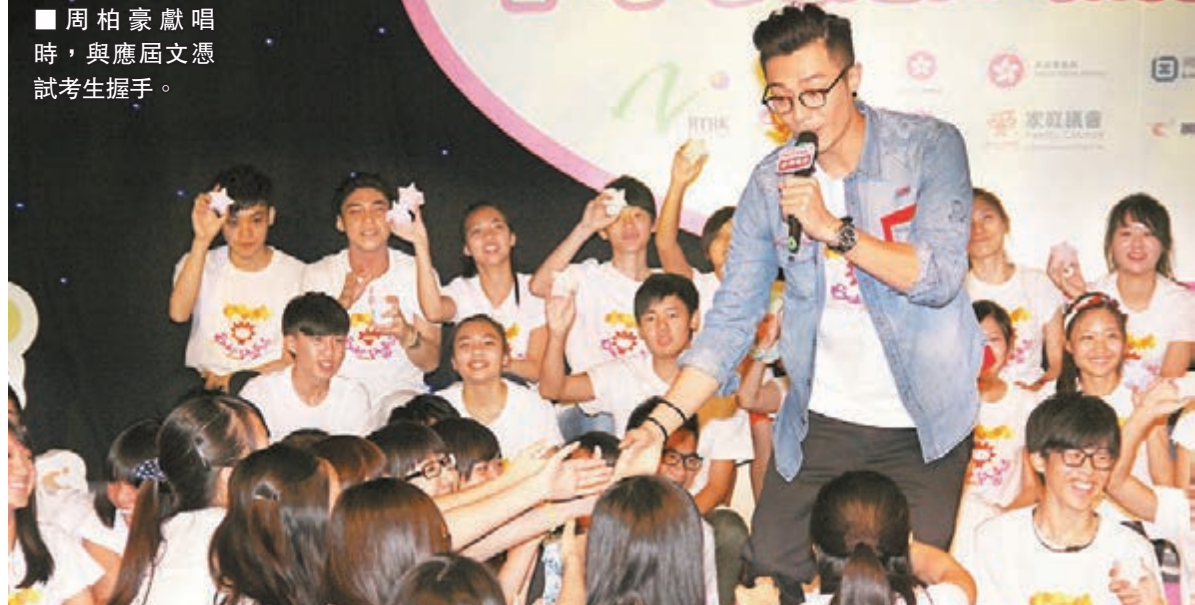
周柏豪獻唱時，與應屆文憑試考生握手。