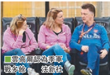
雲高爾認為季軍戰多餘。

蘭，下周到曼聯履新，並於下周三召開準決賽互射12碼不敵阿根廷飲恨，今仗過後便會正式為兩年的第2任荷蘭隊主帥任期畫上句號。這位62歲老牌教頭已決定放棄世盃後的假期，季軍戰後便直接返荷