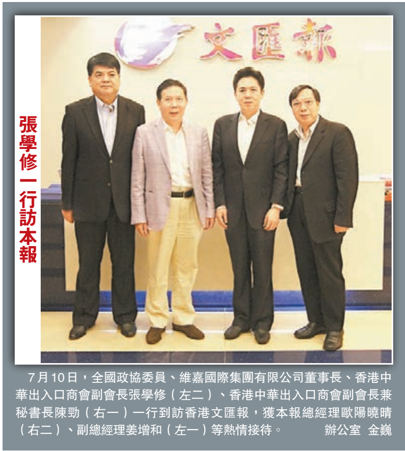
張學修一行訪本報

桂強芳在會面中對連戰在加強兩岸關係方面所作出的積極貢獻表示欽佩。他說，在全球經濟一體化的時代背景下，城市的發展離不開互相之間的交流合作，該會願意同台灣競爭力論壇進一步加強交流與合作，推動兩岸城市交流合作。 桂強芳盛邀連戰出席年底舉行的「香港論壇」，連戰對此表示了濃厚興趣。 在台期間，參訪團先後拜訪台北市政府、桃園縣政府，並與台灣競爭力論壇的專家學者座談，探討雙方資源共享、拓展合作領域。雙方希望今後加強城市發展、城市管理、城市文化等方面的交流，力爭每年都有研究成果。 該會創會17年，研究機構設於深圳。該會已連續舉辦十二屆中國城市競爭力排行榜發布會，涉逾600個城市。其公布的資料現已被哈佛商學院、美國弗里德——哈德曼大學、澳大利亞國際圖書館、莫納什大學圖書館等幾十家學術機構收為參考依據。