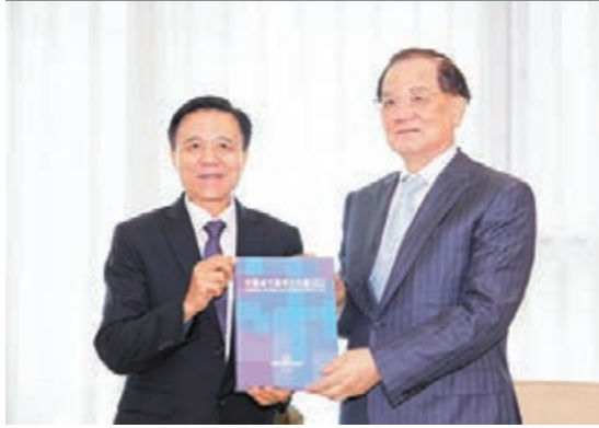
■桂強芳(左)向連戰贈送2013中國城市競爭力年鑒。