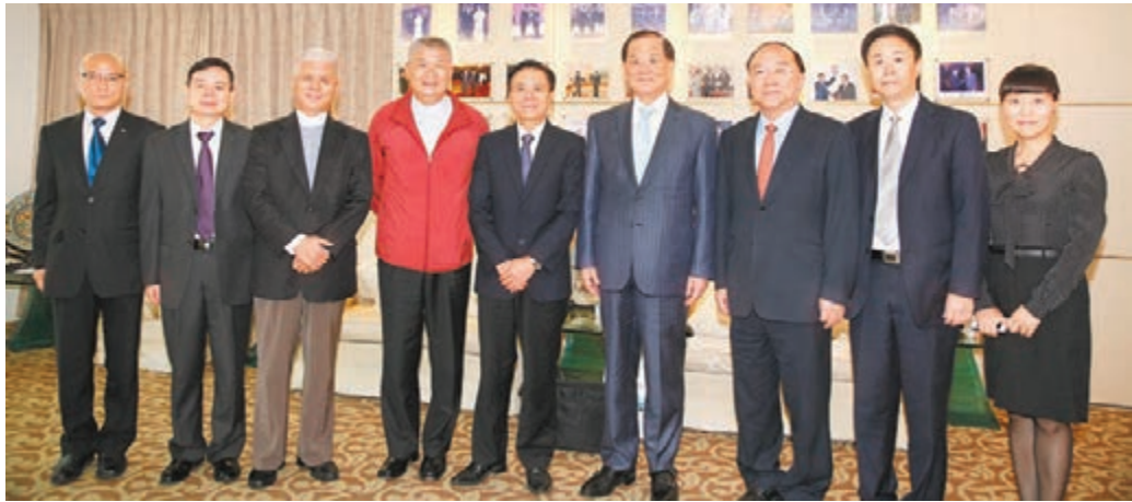
■國民黨榮譽主席連戰（右四）會見桂強芳(左五)一行。

香港文匯報訊（記者 子京）台灣國民黨榮譽主席連戰日前在台北會見「中國城市競爭力研究會」會長桂強芳一行，指兩岸四地城市競爭力課題的研究，具前瞻性和重要意義。他盛讚研究會的研究成果，冀台灣競爭力論壇與內地城市競爭力研究會發揮優勢，繼續推進城市競爭力研究的互補合作，拓展群力綜效的新空間。