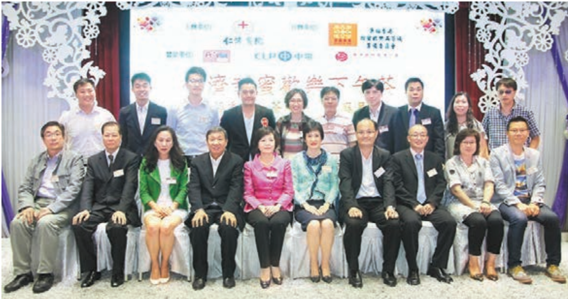
■「築福香港」荃灣區家庭月仁濟甜蜜歡樂下午茶，嘉賓合照。