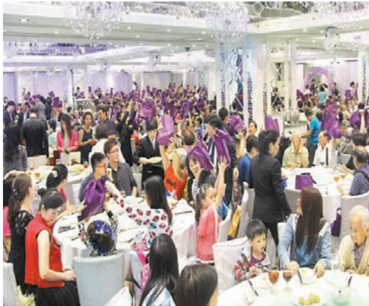
■參加者收到福袋笑逐顏開。