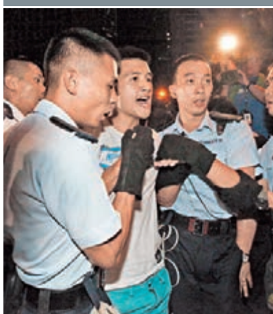
海關總會昨日發表聲明，支持警方在七一遊行期間嚴正執法。圖為當日警方拘捕違法集會人士。

香港文匯報訊(記者 鄭治祖) 香港海關人員總會昨日發表聲明，支持香港警察在七一遊行期間嚴正執法。總會並在聲明中批評，在剛過去的七一遊行，「極少數激進分子」提前「預演佔中」，肆意堵塞道路、妨礙交通，擾亂社會秩序。他們贊同警方果斷採取清場行動，拘捕違法集會人士，有效維護了中環金融中心秩序，更顯示政府維護法治的決心，亦對「佔中」人士以為違法行動不用承擔刑責，起到警告作用。