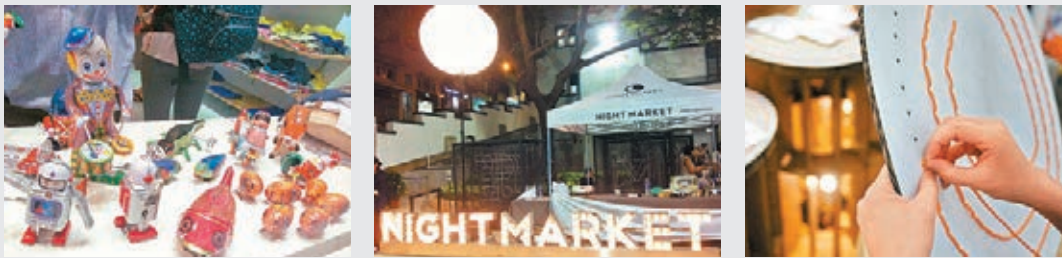
■不同設計師的手作產品