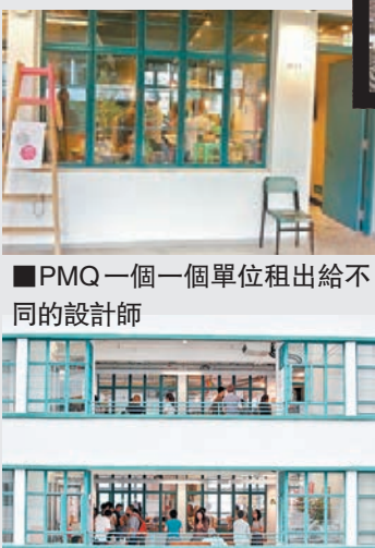
■PMQ 一個一個單位租出給不同的設計師