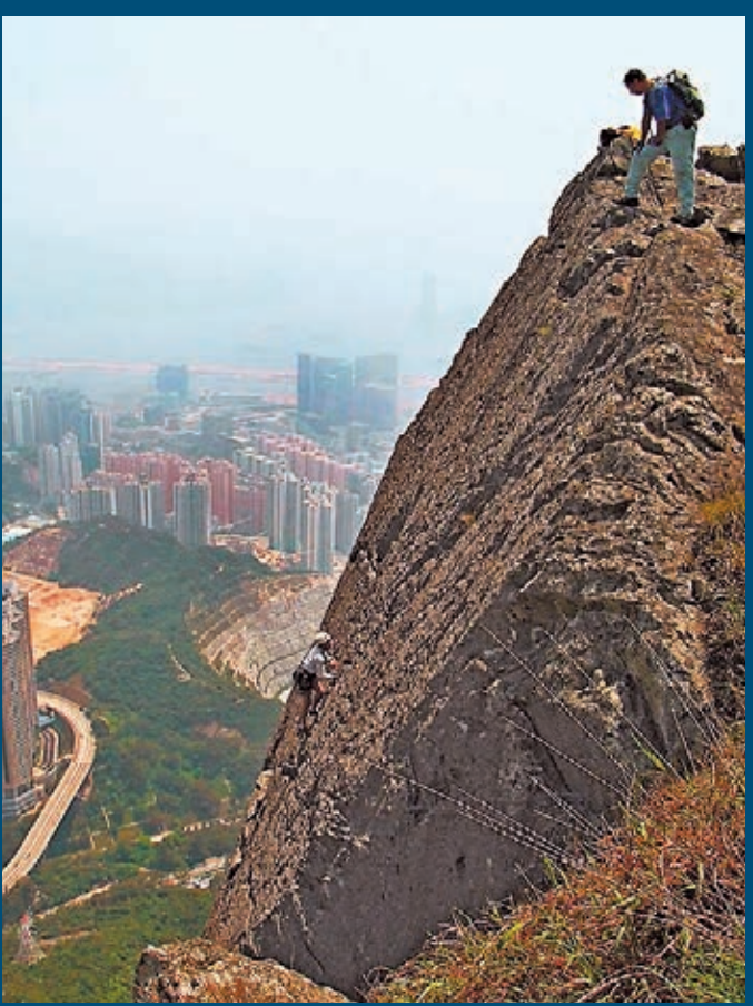
肇事的「天際峭壁」岩面約達90度垂直，攀爬難度極大。