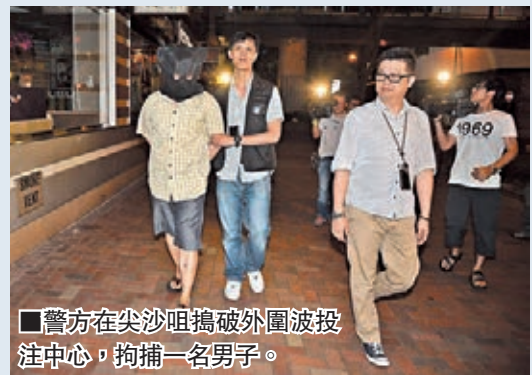
警方在尖沙咀搗破外圍波注中心，拘捕一名男子。

香港文匯報訊(記者 杜法祖)世界盃足球賽事已進入8強之戰，警方在前晚法國對德國賽事開波前，繼續執行「戈壁」反賭波行動，行動至昨日凌晨結束，其間在油麻地友翔道、尖東新文華中心一間水療中心及北角鯉魚涌街，共搗破3個非法收受外圍波賭注的地點，檢獲近4,000萬元波纜，3名涉案男女被捕扣查。