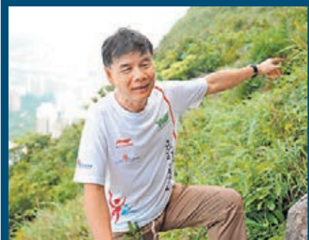
攀石專家表示，攀石活動或多或少都帶有一定風險。