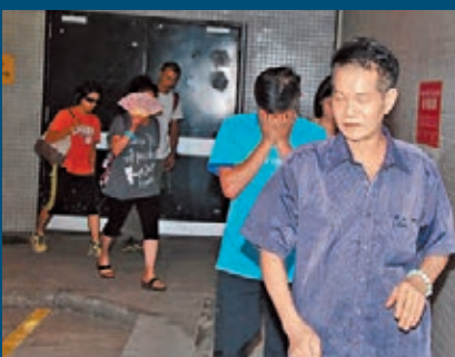
死者家人趕到醫院認屍，各人神情哀傷。

現場為飛鵝山一處名為「天際峭壁」(Skyline Crag)的峭壁，上址並非飛鵝山主壁，但仍是本港攀石界著名活動熱點之一，屬二級難度訓練場。有攀石專家表示，由於上址峭壁岩石十分陡斜，甚至超過垂直90度，攀爬時需要很高平衡力。