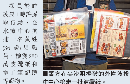
警方在尖沙咀搗破的外圍波投注中心檢走一批波纜紙。

港島總區反黑組早前亦接獲線報，獲悉尖沙咀科學館道14號新文華中心一間水療中心，職員利用工作地點做掩飾，非法收受外圍波賭注，除向水療中心客人收受波纜，還會用電話收受其他人的投注。