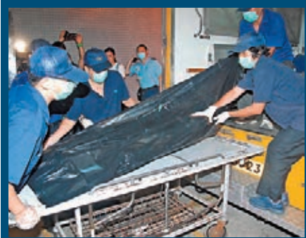
死者遺體移送殮房，待驗屍確死因。