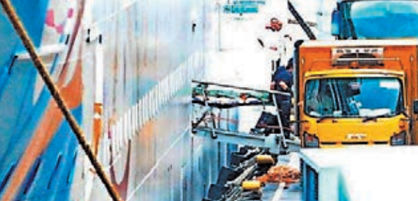
乘郵輪時猝死的老婦遺體從郵輪抬離登岸。

香港文匯報訊(記者 杜法祖)年逾七旬老婦7日前隨親人參與「處女星號」郵輪往台灣旅遊，共聚天倫。詎料，該船駛離香港水域後，她突然昏迷猝死，在親人同意下，遺體一直留在船上，直至昨晨始隨船返港，交由伴工昇送殮房處理，事件沒可疑。