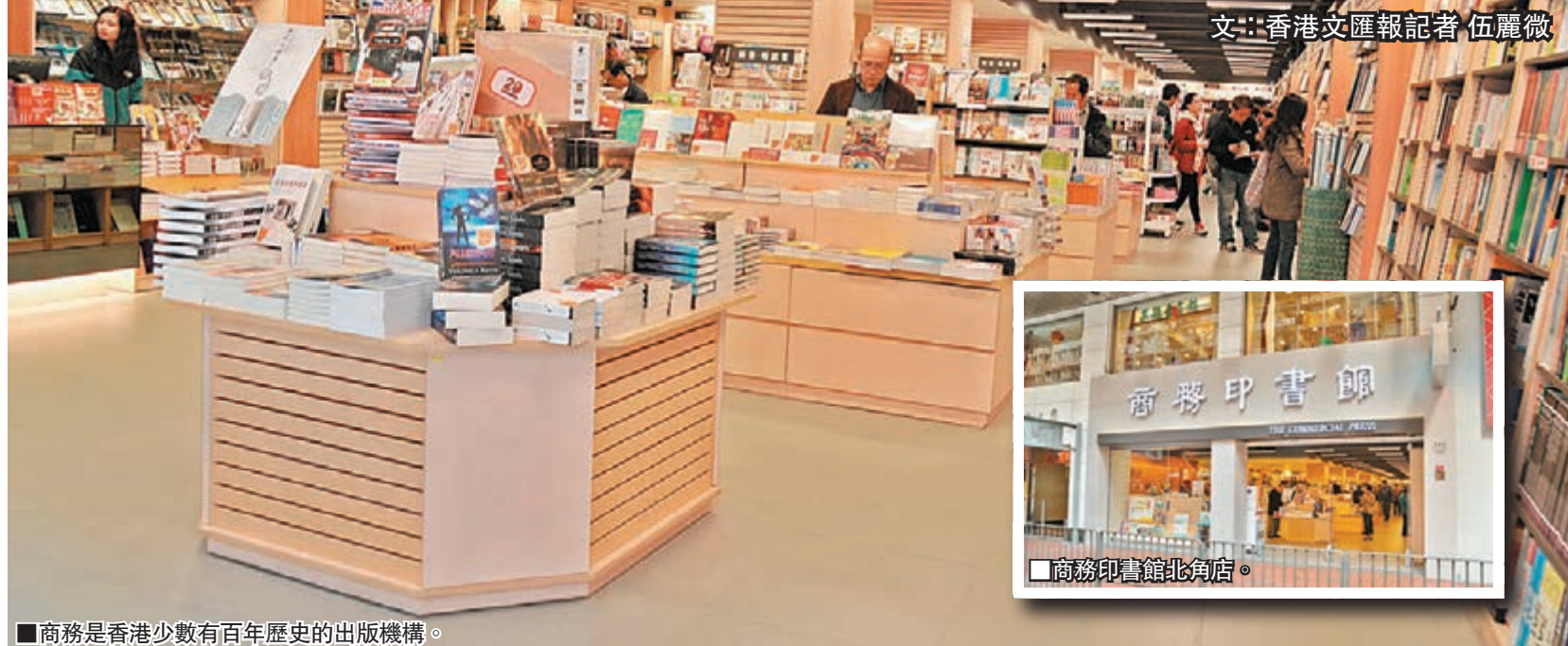
■商務是香港少數有百年歷史的出版機構。