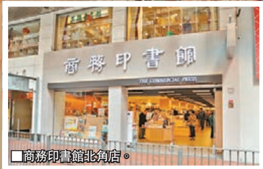
■商務印書館北角店。

為了貼近本地讀者，商務今年一口氣推出多本本土書，如《香港古橋—圖說古橋歷史與建築工程》、《荷李活道警察宿舍二三事》、《城境—香港建築1946-2011》、《默獻向上游—香港五十年代社會影像》等。但講到創新獨特，不得不提《香港中草藥大全》及《香港文學大系》。