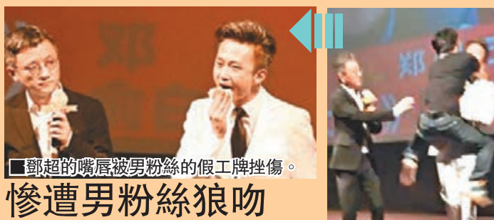
■鄧超的嘴唇被男粉絲的假名牌撞傷。