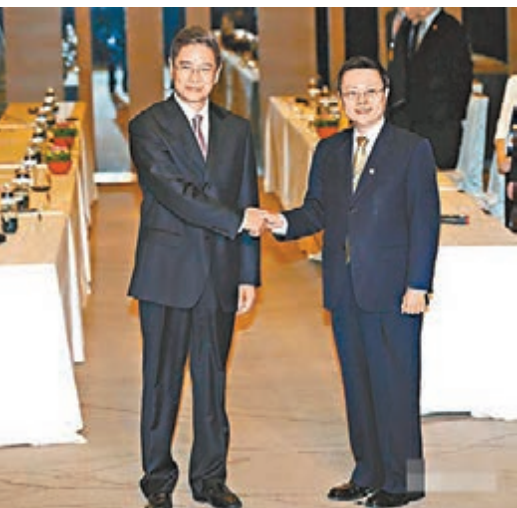
■國台辦主任張志軍日前與王郁琦舉行會談時，明確要求推動兩岸媒體常駐。

一位常年駐台的大陸記者受訪表示，如果赴台簽證能超過6個月，大陸親屬一定會一起來台，因為能夠來台居住一段時間，是很多大陸民眾嚮往的事；如果簽證能進一步放寬，大陸記者也會更願意來台工作，採訪也會更順利，「有些駐台記者來台工作好多年，他們的大陸家屬卻還沒有機會來台」，希望這些規定能盡速鬆綁。