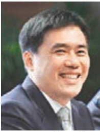
■郝龍斌籲綠營凍結「台獨」黨綱。

香港文匯報訊 據中通社報道，針對民進黨前「立委」郭正亮近期與40位黨內代表，連署希望能在本月民進黨全代會上，凍結「台獨」黨綱。台北市長郝龍斌昨日表示，他個人非常贊成這樣的做法，他過去一直主張藍綠和解、兩岸和解，但民進黨如果一天不處理「台獨」黨綱，不論藍綠、兩岸和解，都是緣木求魚。