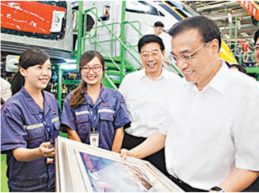
■南車員工向李克強贈送親手製作帶有電力機車圖案的十字繡。 本報湖南傳真