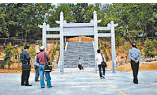
■湖北省廣水市陳巷鎮虎洞沖村的連舜賓墓。

香港文匯報訊 據人民網報道，前日（3日）湖北省廣水市文體新局透露消息，位於湖北省廣水市陳巷鎮虎洞沖村的連舜賓墓被省政府認定為省級文物保護單位。