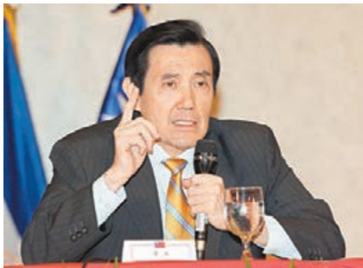
■馬英九前日表示，如中韓一旦簽訂FTA，一定會影響台灣在大陸市場的佔有率。

形容這是「經濟上的核子彈」，建議加速進行與大陸的貿易談判，以免台灣貿易地位遭邊緣化。