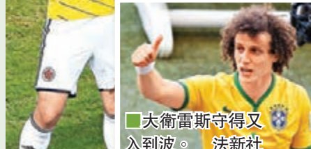
■大衛雷斯守得又入到波。

哥倫比亞入了2球的他日前坦言：「我兒時已為阿仙奴打氣，他們的比賽風格很適合我，若有機會(加盟「兵工廠」)，我會答應。」在前述的排行榜，法國前鋒施馬暫時位列季席，但連續4場當選賽後最佳的阿根廷球王美斯卻意外地只排第11位。