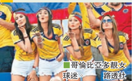
■哥倫比亞多靚女球迷。