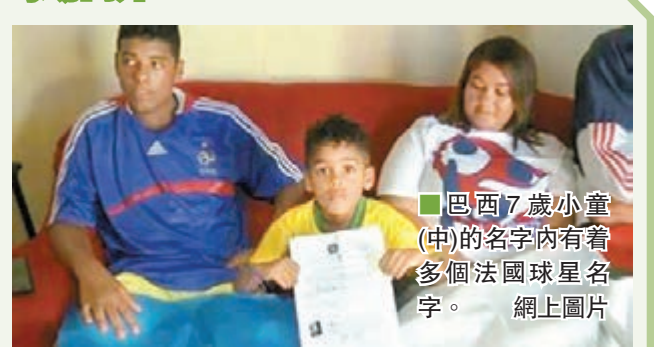
巴西7歲小童(中)的名字內有着多個法國球星名字。