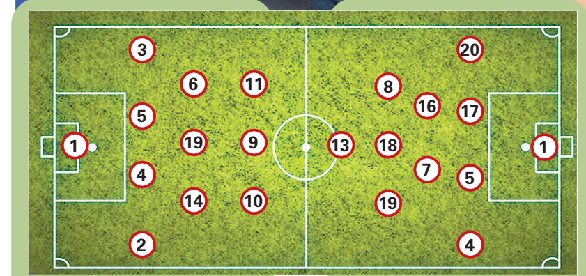
法國預計正選陣容