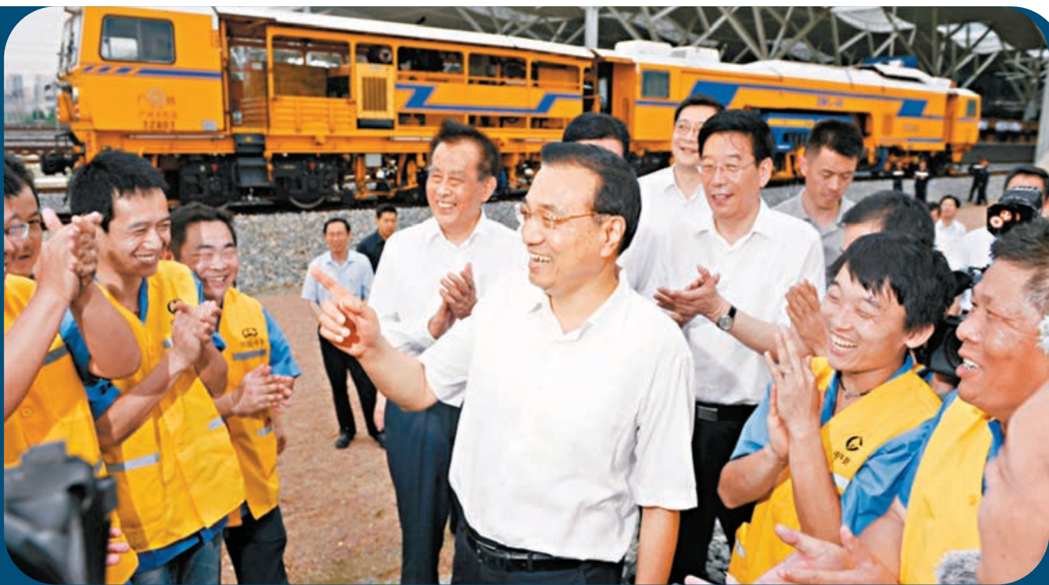
李克強對鐵路工人說，你們既是高鐵建設者，也將會是受益者。

樞紐施工現場考察高鐵建設情況。李克強指出，滬昆高鐵建成後，將帶動沿線發展，惠及貧困山區百姓。