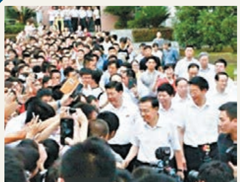
李克強離開湖南大學時，被圍觀趕來的師生層層包圍。

今年4月下旬，李克強曾到重慶考察，提出研究依托黃金水道建設長江經濟帶，為中國經濟持續發展提供重要支撐。6月，建設長江經濟帶上升為國家戰略，長江流域11省市再度迎來發展的「黃金期」。分析認為，此次李克強考察滬昆高鐵建設，冀滬昆高鐵作為貫穿東西部的交通大動脈，起到溝通東西部的經濟動脈的作用意圖明顯。