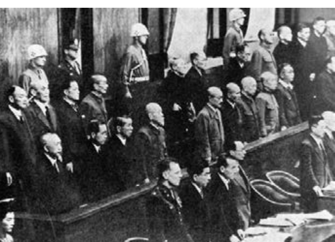
1946年5月3日,遠東國際軍事法庭在日本東京對第二次世界大戰中的日本首要戰犯進行審判。資料圖片

實際執行殺害或虐待者。遠東國際軍事法庭審判的甲級戰犯名單包括荒木貞夫、板垣征四郎、梅津美治郎、大川周明、大島浩、岡敬純、賀屋興宣、木戶幸一、木村兵太郎、小磯國昭、佐藤賢了、重光葵、島田繁太郎、白鳥敏夫、鈴木貞一、東鄉茂德、東條英機、土肥原賢二、永野修身、橋本欣五郎、畑俊六、平沼騏一郎、廣田弘毅、星野直樹、松井石根、松岡洋右、南次郎、武藤章等人。上述的28人於1946年4月29日被起訴。而中國最高人民法院特別軍事法庭於1956年6月至7月對鈴木啟久等45名日本戰犯進行公開審判。記者 張紫晨