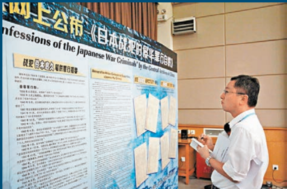
中央檔案館在國新辦新聞發布廳展示部分《日本戰犯的侵華罪行自供》材料。新華社