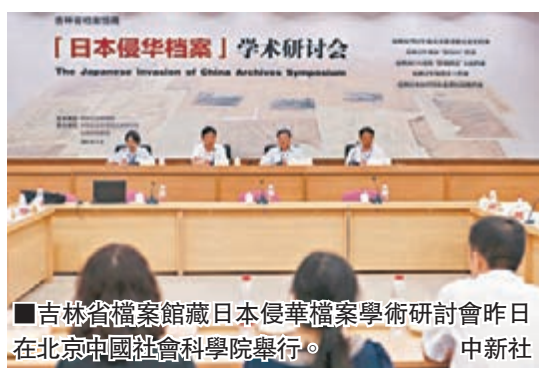
吉林省檔案館藏日本侵華檔案學術研討會昨日在北京中國社會科學院舉行。中新社

涉及「慰安婦」的檔案,蘇智良介紹稱,其中記載了日軍在中國東北各地、華北、華中地區以及印度尼西亞爪哇等地普遍設立慰安所,甚至有「慰安婦」與日軍官兵的比例、某個時段日軍官兵進入慰安所的人數統計等。在關東軍的郵件檢閱檔案中,存有許多被刪除的日軍官兵通信內容,裡面記載了許多日軍推行「慰安婦」制度的細節。「這以無可辯駁的事實表明日軍設立『慰安婦」