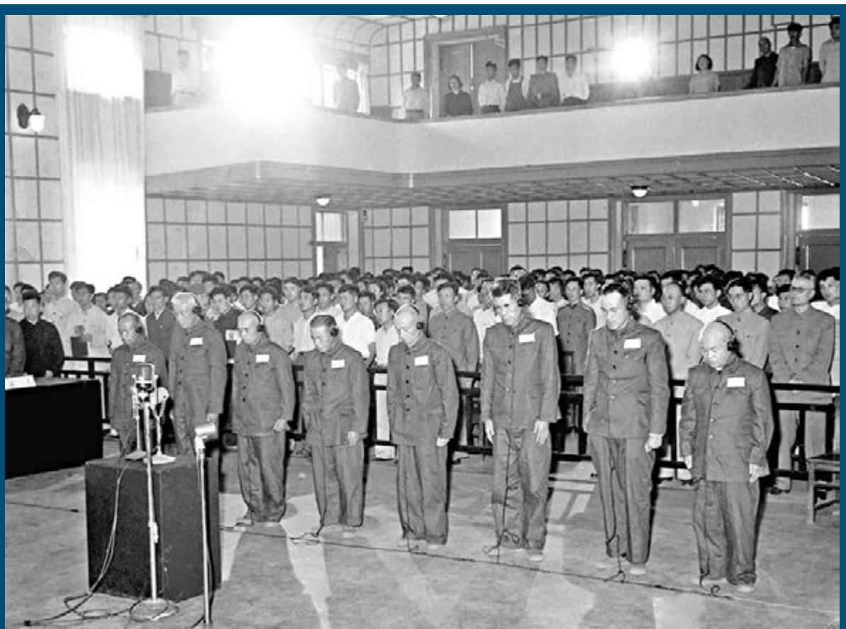
中國最高人民法院特別軍事法庭於1956年6月9日起在瀋陽開庭審判鈴木啟久等8名日本戰犯。資料圖片