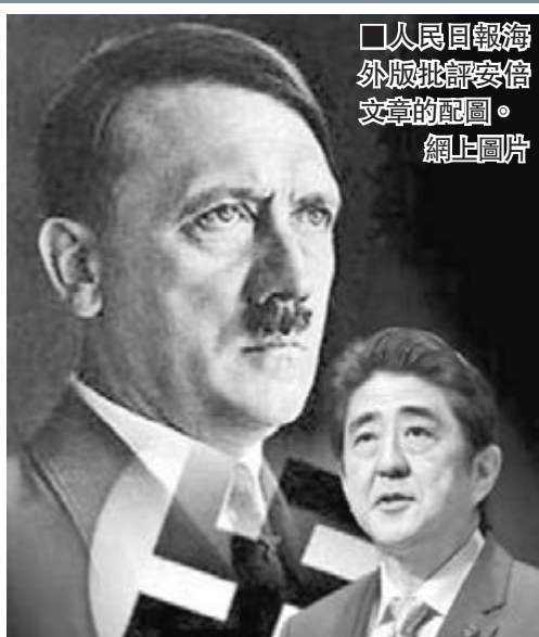
人民日報海外版批露安倍文章的照片。

另外《人民日報》昨日在頭版發表評論指出,日本政府解禁集體自衛權,一意孤行突破戰後體制,是對本國和平力量正義呼聲的公然藐視,也是對戰後國際秩序安排的肆意衝擊。評論稱,日本政府解禁集體自衛權的險惡用心和潛在危害,國際社會看得清清楚楚,安倍晉三的目的是從根本上改變日本二戰後的和平憲法。