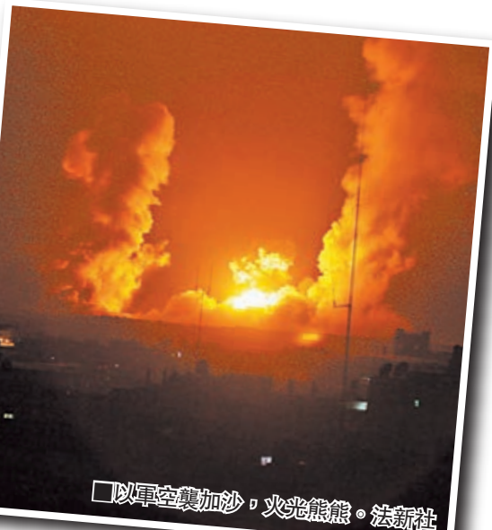
以軍空襲加沙，火光熊熊。