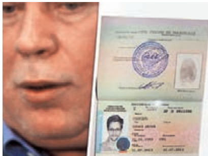
律師去年展示斯諾登的臨時避難許可證。