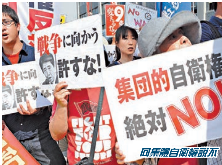
向集體自衛權說不