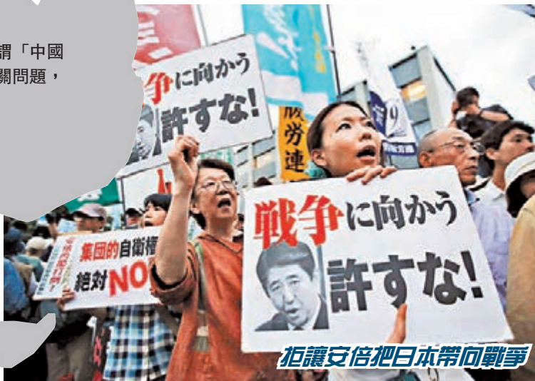
拒讓安倍把日本帶向戰爭