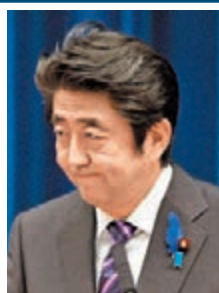
安倍執意解禁集體自衛權。

雖然日本擁有多艘護衛艦和驅逐艦，但主要配合美軍航母作戰，並不適宜投入東海防禦。如果日方不考慮組成備戰輸送船隊及研究島鏈防禦措施，一旦東海出現戰事，日本的島鏈防禦體系將不復存在。