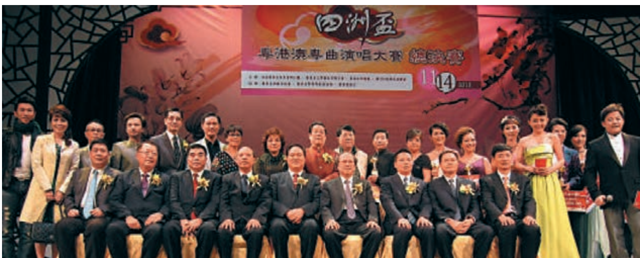
由2003年開始至今，連續十年贊助廣東省政協「四洲盃」粵港澳粵曲演唱大賽。