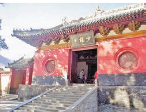
少林寺大門。

從地理環境上看，少林寺背依五乳峰，四圍群山環抱，層巒疊嶂，形成一道天然屏障，宛如被老嫗攬於懷中。