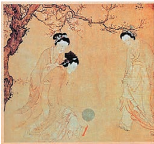
古代女子蹴鞠。

傳統的章回小說裡，「盤絲洞」不是一個陌生的詞語。盤絲洞裡居住的，一般都是可怕的女妖。在《西遊記》第七十二回裡，唐僧在盤絲洞前做了一次女子足球的觀眾。