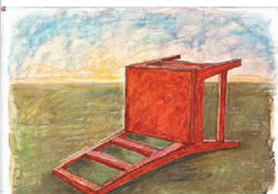
■毛旭輝《倒在地上的靠背椅》