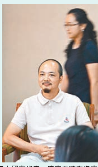
■中國藝術家、清華美院陶瓷藝術系主任白明。

對於此次個展，白明表示，很慶幸自己出道時沒有選擇完全按照西方流派發展，而是在回歸東方文化中，在中國傳統陶瓷中找到了內心寧靜的力量。他說：「我的作品是在受盡了中國傳統文化的浸潤後，生出的屬於今天的果；我們不是要向世人展現中國過去的歷史長河，我們正是這江河流到今天的一部分。」