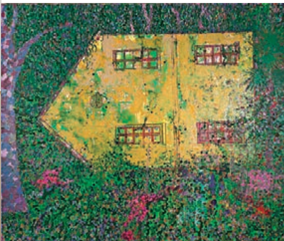
■毛旭輝《昆明組畫·故居》