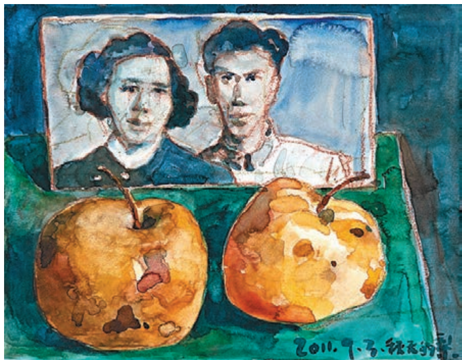
■毛旭輝《兩個梨和父母的照片》

在毛旭輝這一系列作品中，我們直觀上感到最鮮明的意象便是「倒下的靠背椅」，而這其實是從2011年至今的階段中，毛旭輝創作的內容。